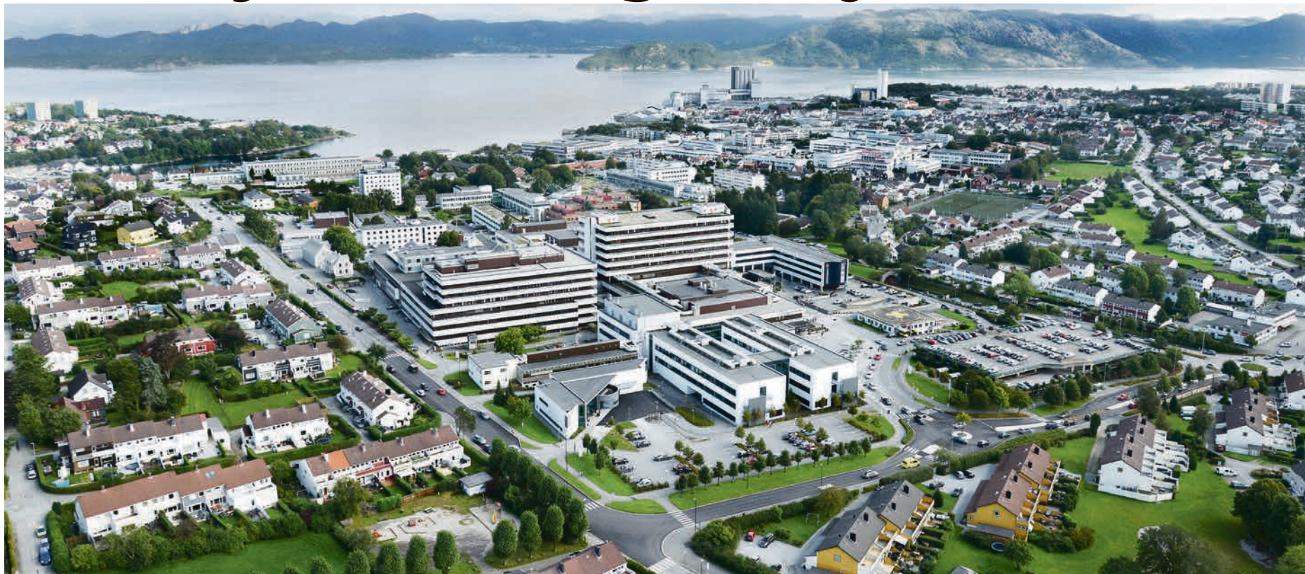
NY IDENTITET: Dagens sykehus ruver godt i landskapet, men området skal på sikt få ny identitet.