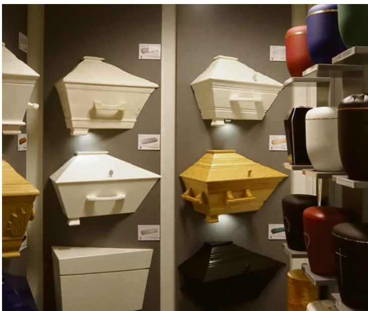
UTVALG: Her er et stort utvalg av kister og urner. Det er bare å velge det som passer best.

En bevisstgjøring når det gjelder livets avslutning, er viktig. Obed begravelsesbyrå ønsker å kunne bidra til at alle får en verdig og fin avslutning på livet. En avslutning som kan gjenspeile det livet som er levd.