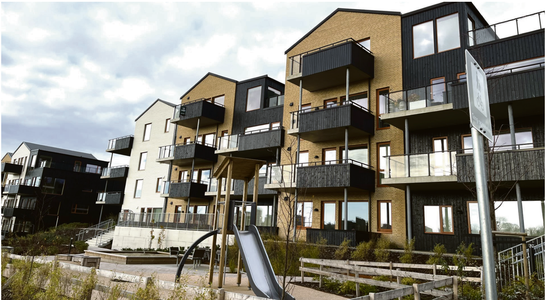
MARIEBO: Lavblokker med gode utplasser.

Langs den nye flotte bussveien mellom Stavanger og Sandnes prioriteres bygging av boliger som kan dra nytte av et særs godt kollektivtilbud. Mariero er et slikt område. Det har kort vei til tittgjengte busser og tog – og gangavstand til et stort utvalg av butikker og spisesteder. På en varm sommerdag er veien kort til Vaulen badeplass – og til badstuene i Jåttåvågen resten av året. Liker du deg best med klær på finnes det mange flotte turtraseer i umiddelbar nærhet.