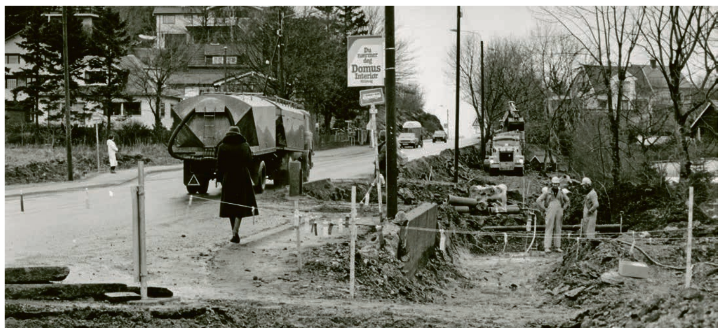
SKJÆRINGEN: Trolleybussen hadde endeholdeplassen ved Maskinhuset, så hvis du kom sørfra og skulle til eller gjennom Hillevåg, måtte du ta jernbanebussen. Her fra stoppestedet like før Skjæringen sørfra.