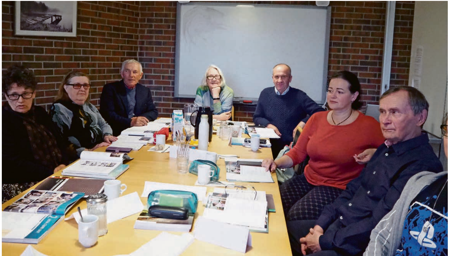
MANGE LAND: Her sitter ivrige elever fra mange land. De vil alle lære seg å snakke norsk