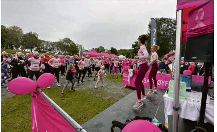
FØR START: Felles oppvarming før løpet.