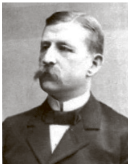
SALOMON AUGUST ANDREE: Han var en svensk ingeniør, polfarer, politiker og ballongfarer.

Andree ble betegnet som en totalt udugelig person som tok med seg 2 unge menn i døden for å nå et mål han vet ikke kan nås.