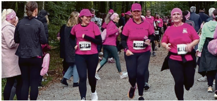
FEST: Masse folk rundt hele løypen som heiet de sprege deltageren frem.

Den 5. oktober ønsket Rosa sløyfe-løpet for tredje år på rad velkommen til løp rundt Mosvannet for å skape økt oppmerksomhet rundt brystkreftsaken, og inntektene går til Rosa sløyfeaksjonen og deres forskning på brystkreft. Rosa sløyfe-aksjonen har blitt arrangert i Norge siden 1999 og har bidratt med over 415 millioner kroner til brystkreftsaken. Flere enn 100 frivillige bidrar hvert år og gjør arrangementet mulig.