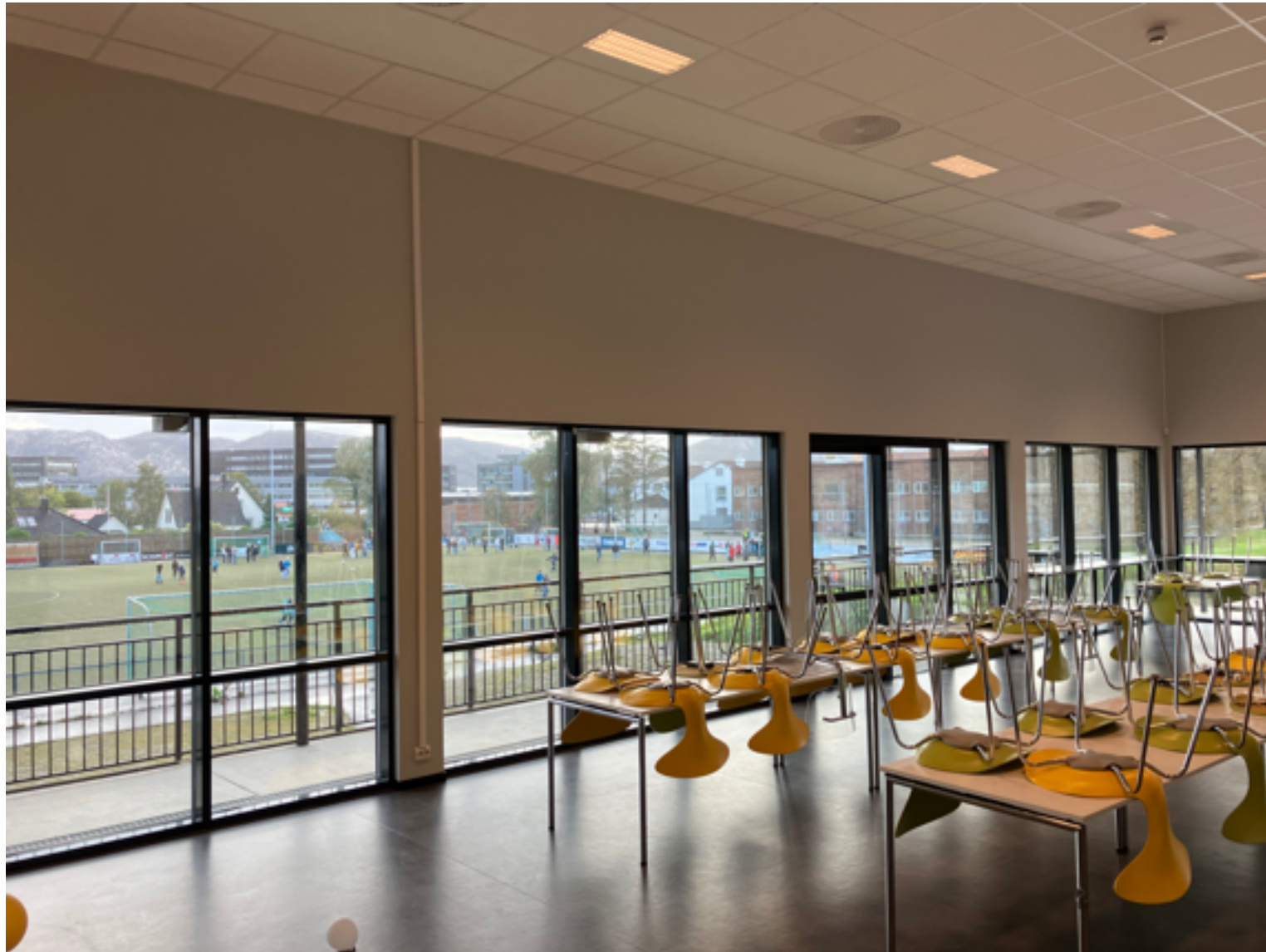
Innsiden av Jåtun-salen