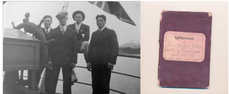
Unge sjøfolk på akterdekk, og forside av sjøfartsbok.

Sir Noel Philip Barker, engelsk fredsprisvinner