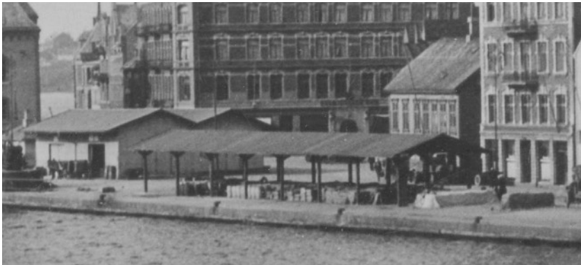
Eldre bilde viser søylene i bruk i havneskur på andre siden av vågen, på Skagenkaien ved tollboden.

Helmich Gabrielsens plass framstår i dag som noe tung, mørk og lukket. Det skyldes i stor grad den massive konstruksjonen som opptar store deler av plassen. Konstruksjonen er sjeldent i bruk, og bærer også preg av dårlig vedlikehold.