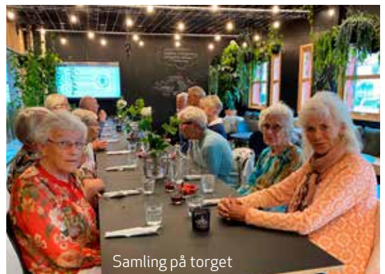
Samling på torget

Aktiviteter og arrangementer på torgene: Her kan lag- og foreninger arrangere egne aktiviteter, el. du kan delta på arrangementer i regi av innbyggertorgene.