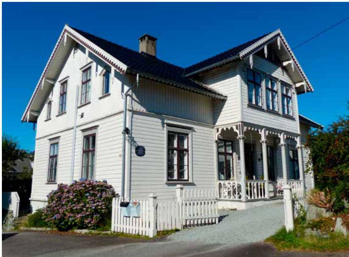
Brønngaten 63 – Solbakken slik huset fremstår i dag.

bedre her enn de ville hatt det på vanlige barnehjem. Dette var jo ikke foreldreløse unger, men mor og far var så uendelig langt borte. Ekstra ille ble det under siste verdenskrig hvor det gikk over 5 år før man fikk se sine kjære igjen.