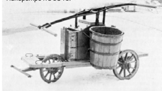
Håndpumpe fra 1841.

Mandag kveld 27. desember 1841 i 23-tiden ble det skutt fra kanonene på Valberget så vindusrutene i nabolaget klirret i hundrevis. Rullegardinene for til topps, og fra de stille gater steg ropene: «Brann, Brann!», blandet med: «Kor e det henne, kor e det henne?».