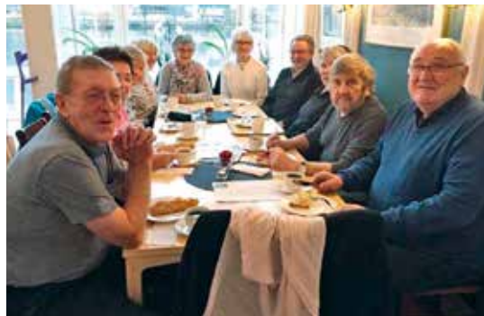
Bilde (før mars -2020) av «Ungane i Gadå» fra Lagårdsveien som treffes på Kafe Breiavatnet hver 3.torsdag.

Åpningstider: 1.Torsdag: i mnd. kl. 11.00 – 12.00 De gir råd og veiledning om tilbud og rettigheter for personer med nedsatt hørsel. (Rådgivningskontorene følger skolens ferie)