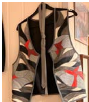
Applikasjonsteknikker fra 1970-80-tallet.

enestående, sier hun nå. -Her var livet så mye mer sosialt. Selv om dere også hadde klasseforskjeller, var det vennligere og åpnere, og lettere å få kontakt. Alle kunne snakke med alle. I Østerrike var folk mye mer opptatt av å kritisere, den gangen.