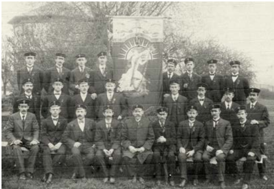
Koret avbildet med røde luer.