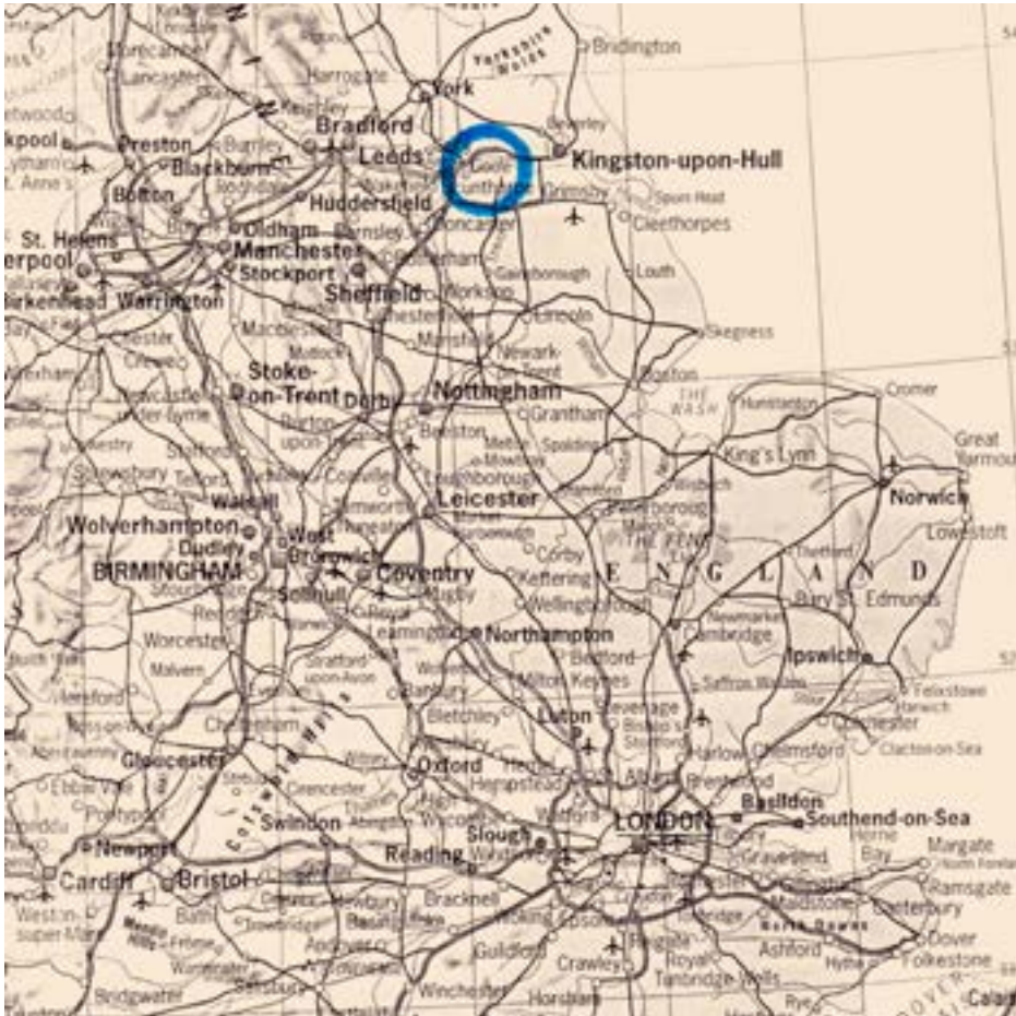
Kart over England som viser beliggenheten av den vesle byen Goole på østkysten.