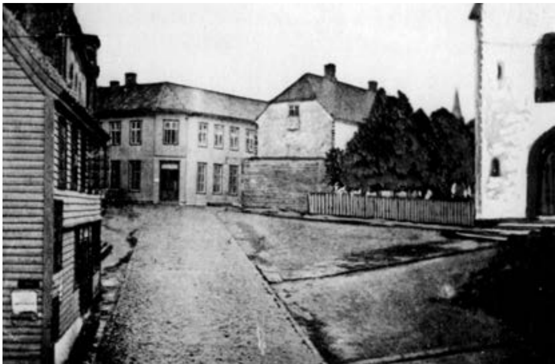
Til høyre ser vi Domkirken. Ved dens venstre side Mariakirken – brannstasjon fra 1866 – 1883. Huset i enden av gaten het Hotel du Nord og ble byens andre brannstasjon.

Når historien om Stavanger brannvesens etablering skal skrives, kan man ikke unnlate å ta med noe om Mariakirken, som merkelig nok endte opp som byens første brannstasjon.