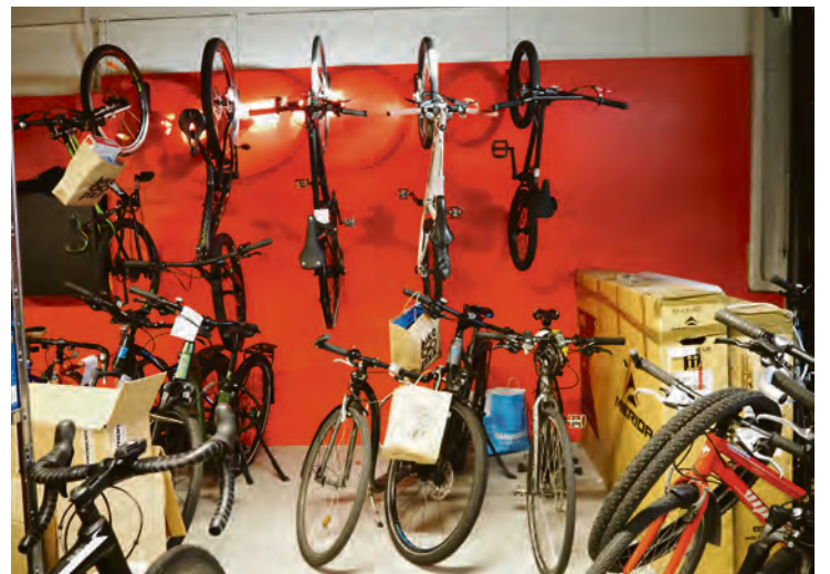
SYKLER FRA GULV TIL TAK: Nei, vi sykler ikke på veggene, men det er bra å ha veggplass når utvalget er stort.

Men ikke alle sykler har motor. Vi kan også få kjøpt vanlige sykler. Sondre nevner en slags grusracer, gravel sykkel. Denne er populær både for trening og jobbpendling, og kan leveres både med og uten motor.