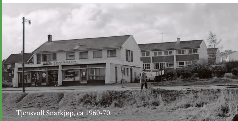
Tjensvoll Snarkjøp, ca 1960-70.