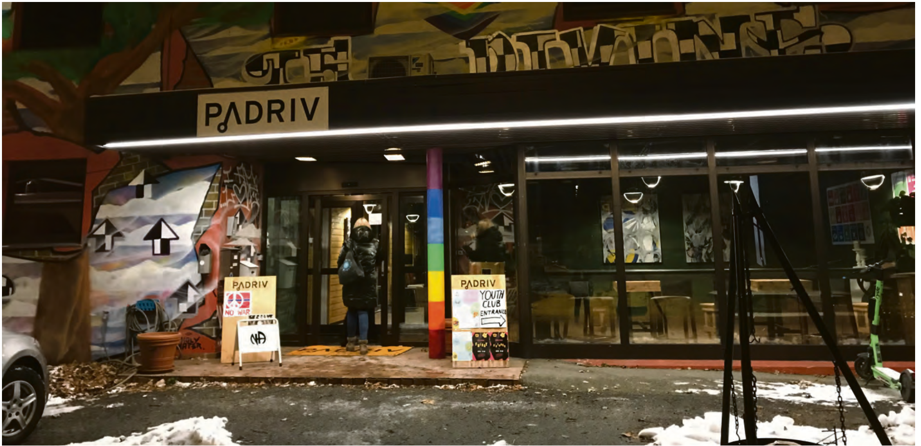
Pådrivhuset i Flintegata