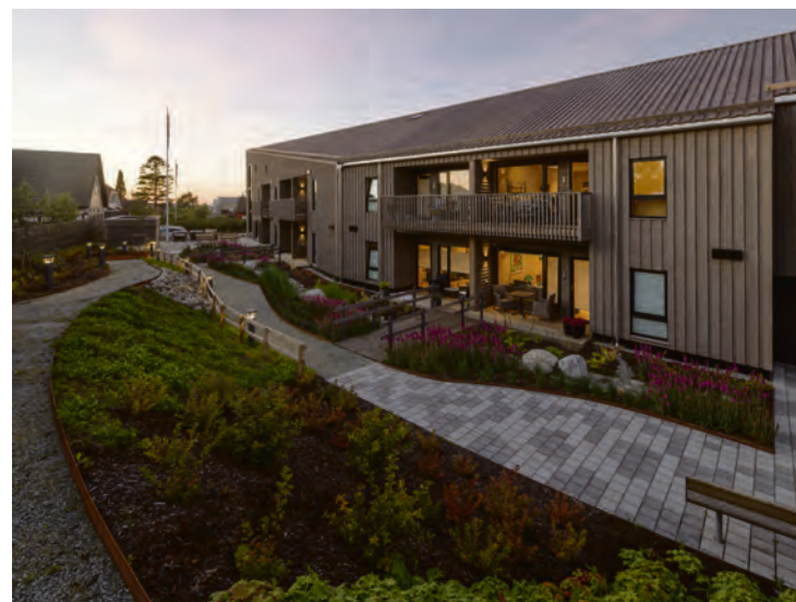
BYGGET: Leilighetsbygget i Solborgveien 8 på Tjensvoll.

– Det er en fantastisk gruppe mennesker som jobber her, som vi er veldig stolte av. De gjør alltid det lille ekstra for å