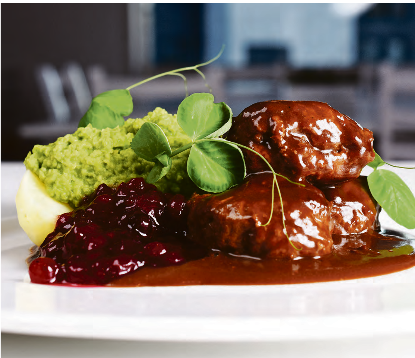
KJØTTKAKER: Kjøttkaker er en favorittmiddag i de fleste hjem, og den er lett å lage.

Kjøttkaker er kanskje en av de mest populære tradisjonsrettene vi har i dette landet. Dette henger først og fremst sammen med at det er veldig godt, og at kjøttkakene lages slik man liker dem best. Noen vil ha dem faste mens andre liker dem litt løsere. Uansett bør de være saftige. Variasjon i tilbehøret er også stort. I barndommen fikk jeg dem med både kålstuing og ertestuing. Nå lager jeg dem som i oppskriften her, og med det tilbehøret som du se på bildet. God fornøyelse.