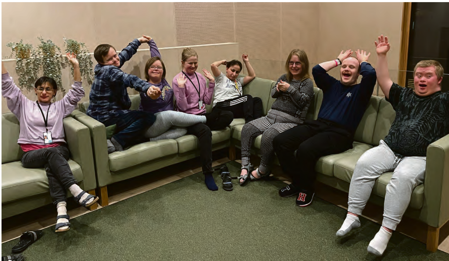
SAMLET: Gladgjengen samlet i sofakroken.

Hvordan er det å bo her på Solborg bofellesskap?