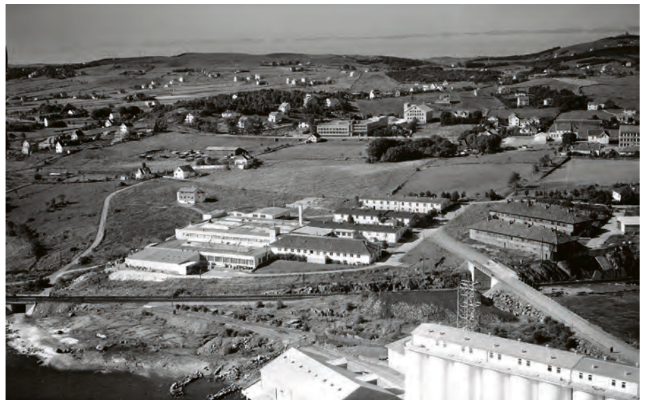
STAVANGERFLINT 1953: Rogaland Felleskjøp i forgrunnen. Stavangerflint like bak. Kvaleberg skole til høyre midt i bildet. Mot Auklend / Auglend