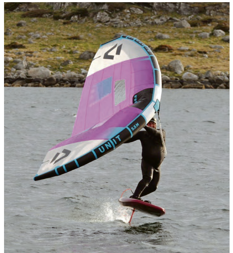
WING FOILING: Dette er Wing Foiling som er den nyeste varianten av brettseiling.

Nå vet vi at surfing er mye mer enn å stå på et brett ute i bølgen. Som Jørgen sier – det blir en livsstil. En livsstil som forutsetter godt og riktig utstyr, og kyndig veiledning. Det får man her. Det er bare å komme!