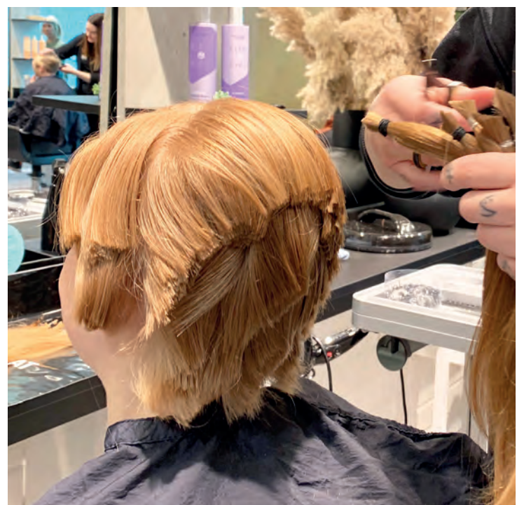
UNDERVEIS: Etter at siste hårlokk var klippet, gjensto en ny frisyre.