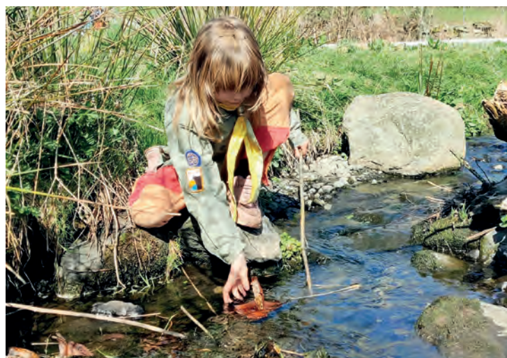
SEILER NED BEKKEN: En populær aktivitet for de yngre speiderne var å lage barkebåter.