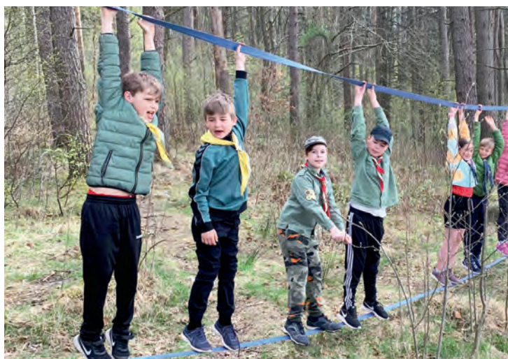
LIVLINE: Speiderne øvde seg på å kaste livline, noe som er viktig å kunne den dagen noen trenger hjelp.