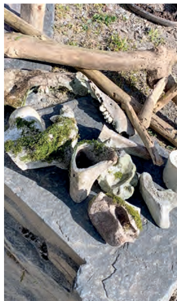
SAU ELLER DINOSAUR?: Funnet av bein vakte interesse og undring.