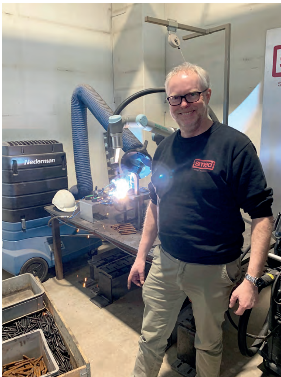
SPESIALMASKINERI: Med sveiserobot kan smeden lage mye forskjellig.

– Før krigen, da farfar startet bedriften, dro bøndene forbi Randaberg på vei