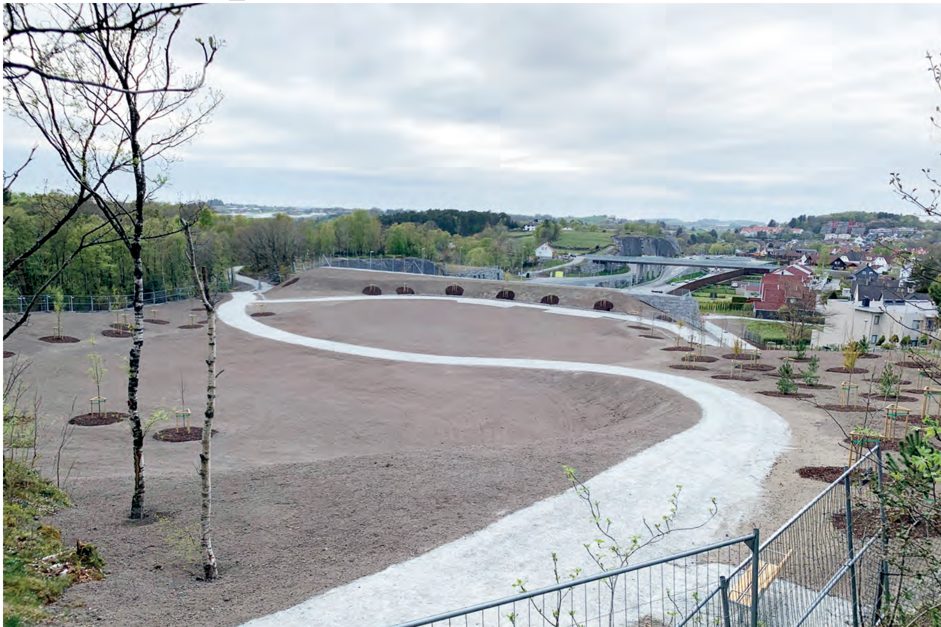
SNART ET GRØNTOMRÅDE: Trær er plantet og nå skal gresset spire. Vegvesenet håper å kunne åpne parken for publikum i juli

Statens vegvesen håper å kunne åpne det nye grøntområdet over nordre portal av Eiganestunnelen i juli.