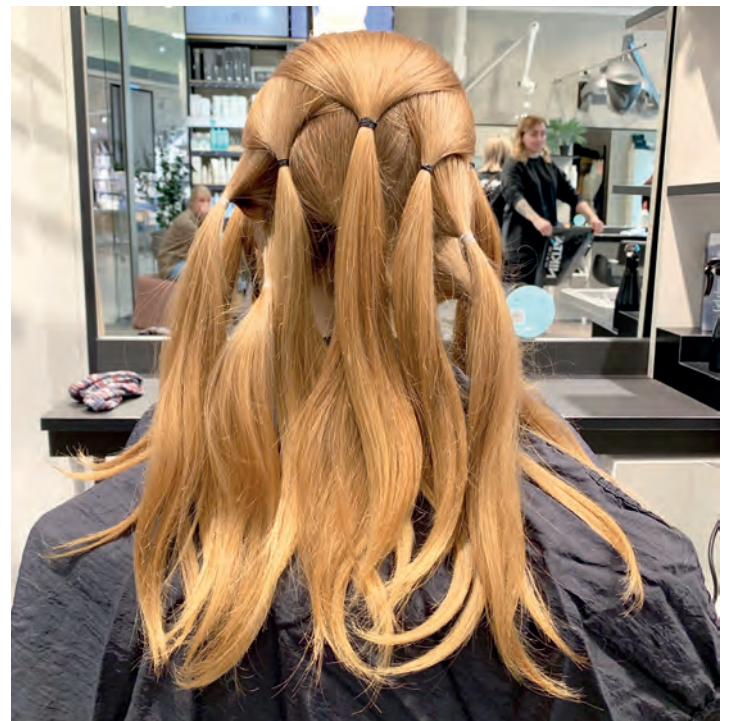
FLETTET: Det lange håret ble delt inn i fletter.