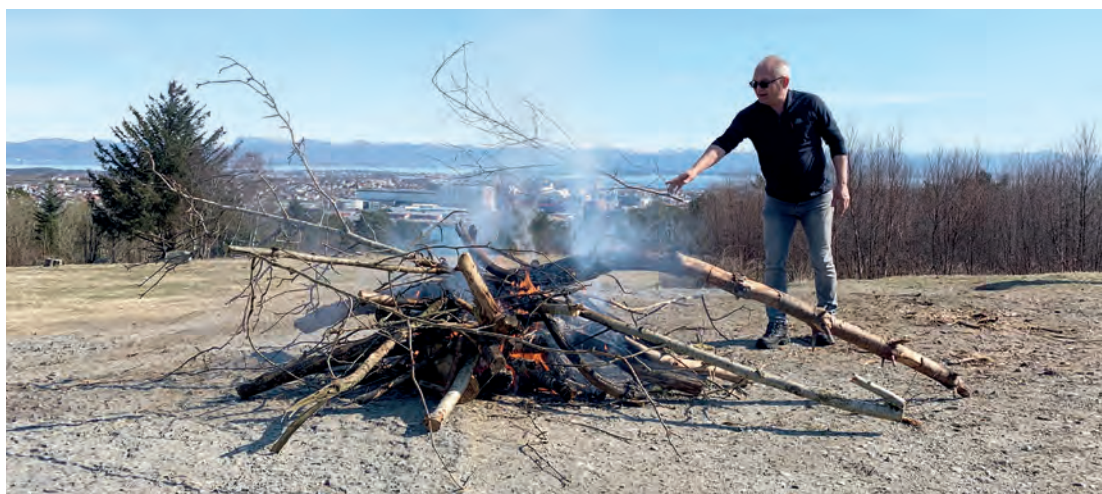
REN ILD: Til akkurat dette formålet kunne man faktisk ha ønsket seg våtere trever.

Som på forhånd omtalt i Tastavis, ble det 2. april tent en vete på toppen av Tastaveden. Noe såpass uventet som knallfint vær kom imidlertid litt i veien.