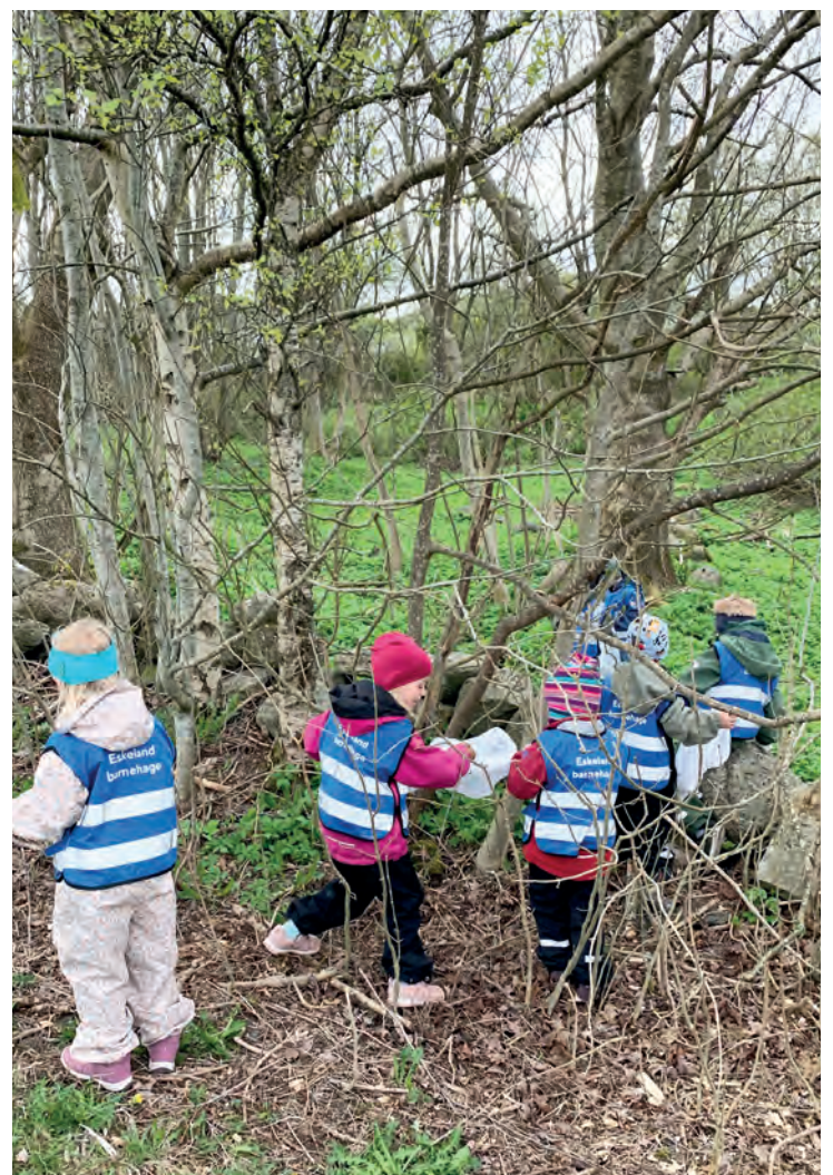
SØPPELSKOGEN: Skogholtet et steinkast fra barnehagen var målet for ryddedugnaden.