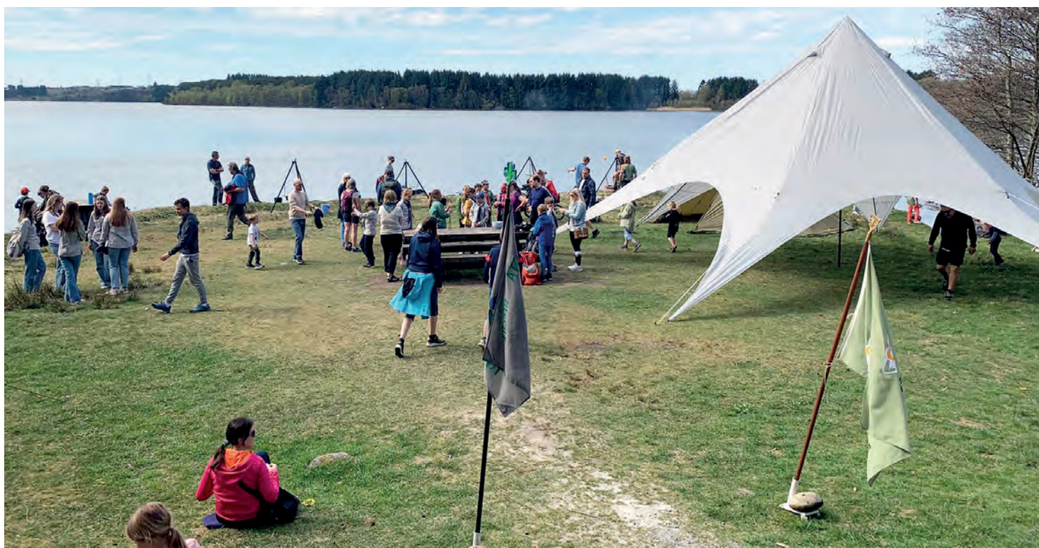
SPEIDERLEIREN: Speiderne hadde nesten ikke trengt telt på denne solfylte dagen, men mottoet deres er jo «Alltid beredt.»

Store og små koste seg med å grille pølser og pinnebrød, og popkorn ble poppet på bål – proviant behøvdes jo imellom aktiviteter som rebusløype, slakk line, barkebåter og livlinekasting.