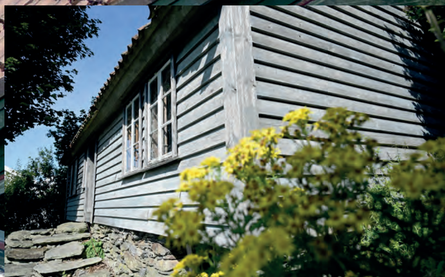
GRUNNMUR I STEIN: Grunnmuren som er bygd med stein er i god stand.