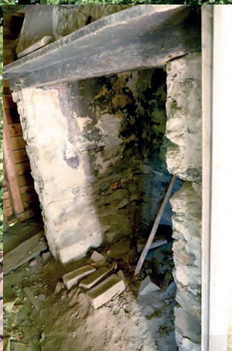
GAMMELT ILDSTED: Ildstedet er fortsatt synlig og fullt mulig å tilbakeføre slik det var i 1777.