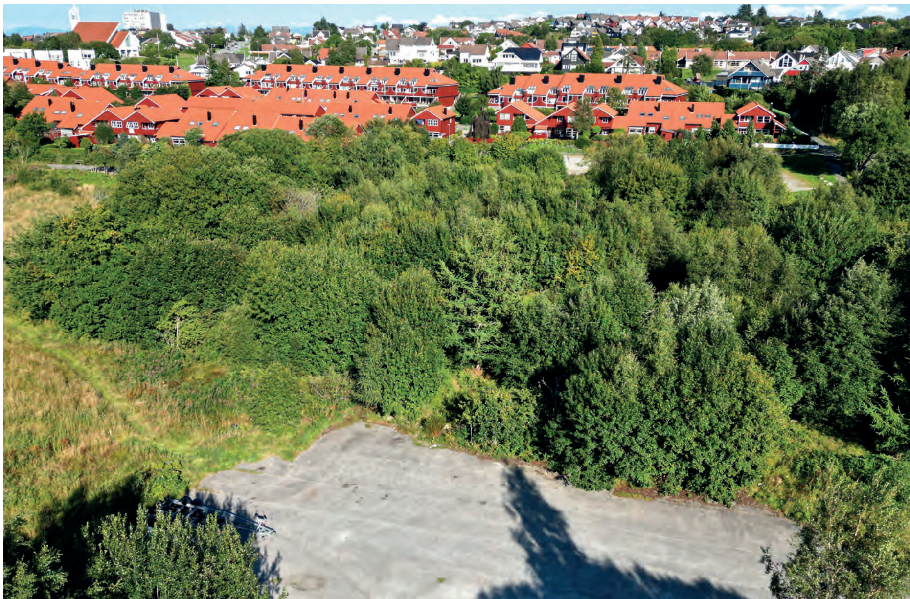
RESTER AV GRUNNMUR: Det var her Tastaforen asylmottak lå, og fortsatt kan en finne rester av grunnmurer.

Det er fortsatt spor etter Tastaforen asylmottak som ble åpnet i 1989. Den gang kom flyktningene fra hele verden. Krigen i tidligere Jugoslavia startet i 1991 og Norge tok imot mange flyktninger fra Kosovo, Kroatia og andre land i det tidligere Jugoslavia.