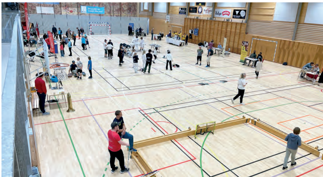
ENDELIG FRIVILLIGHETENS DAG: Frivillighetens dag ble avholdt på Tasta søndag 21 august i Tastarustå Idrettshall

Alt i alt ble det en fin dag på Tasta hvor mange lag og organisasjoner fikk presentert seg, og mange fant ut hvilke tilbud som finnes. Dog finnes det enda flere enn de som deltok, så dette kan gjerne gjøres om igjen et annet år. Takk til alle som bidro til en fin dag og tusen takk til alle frivillige!