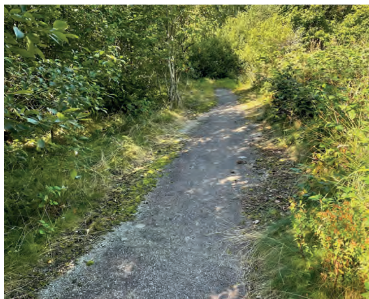
ASFALTERTE STIER FRA EN ANNET TID: Går en i skogen finner en asfalterte stier etter asylmottaket.

Dere kan lese reportasjen i faksimilen, men hver gang jeg går tur på Tastamyra med Milo, hører jeg barnestemmen til ett av barna som ivrig peker på et bilde på veggen – Tastaforen.