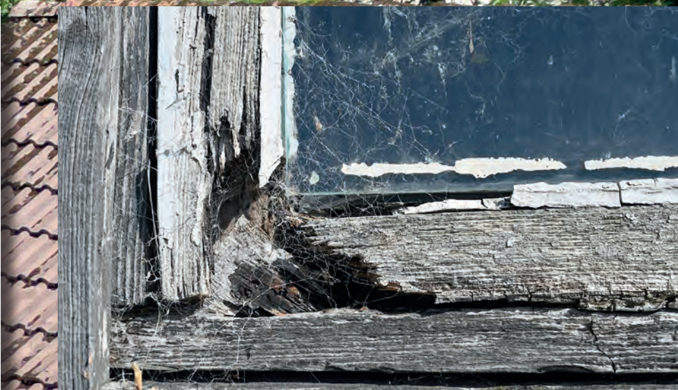
TRENGER VEDLIKEHOLD: Utvendig trenger huset vedlikehold, og får eierne midler ønske de å skifte vinduer og kledning på deler av huset.