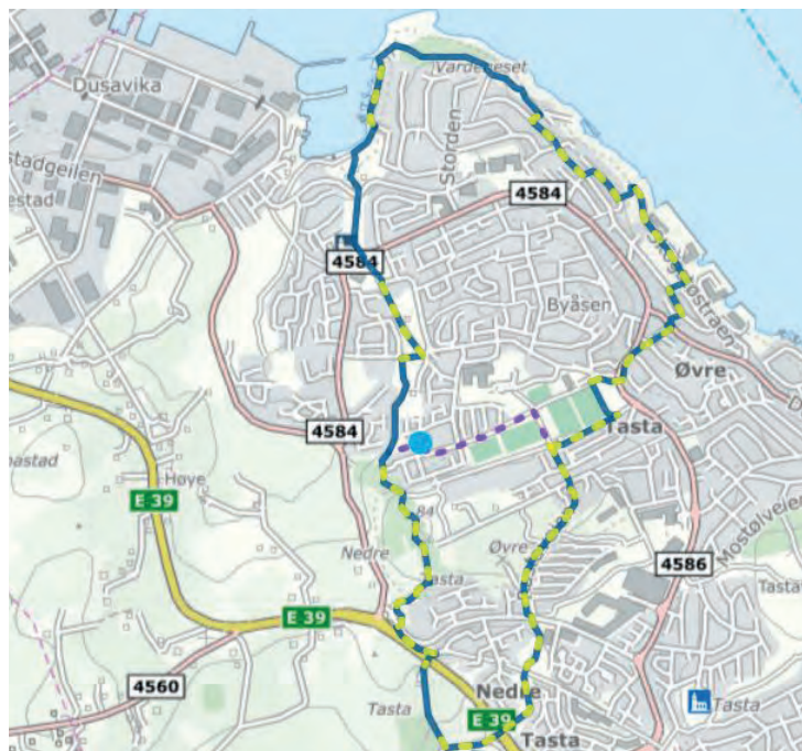
VARDENESTUREN: Her er kartet over turen på Vardenes.

Du kan gjerne starte fra parkeringen ved Mississippi rensesepark. Her går du under E39 og følger en buktende turvei oppover mot Tastarustå.