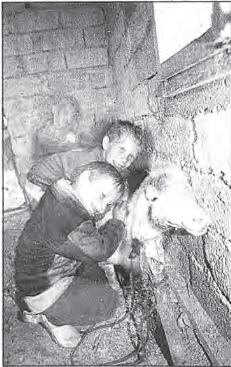
Ungene var lenge borte, nå er de tilbake.

Stor stas i det fattige muslimske hjemmet når nordmenn kommer til gårds. Beste-far, bestemor, onkler og en stor barneflokk viser oss inn i mannsrommet i hovedhuset, der hve sofaer står langs veg-