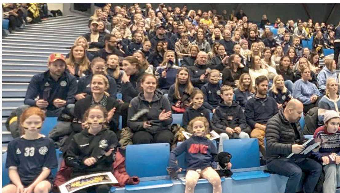
FULL OPPSLUTNING: Tasta Håndball tok 1/4 av de 1200 setene i hallen under kampen.

Det er ikke ofte et håndballag fra Rogaland er med Europaligaen, men når det skjer så stiller Tasta opp! 353 medlemmer av Tasta håndball møtte opp første hjemmekampen damelaget til Sola håndball skulle spille!