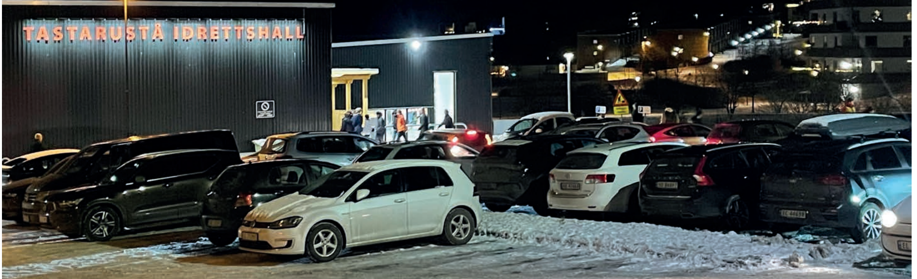
TETT OPPFØLGING AV FORELDRE: Her er ungdommene på vei inn i Tastarustå idrettshall for årets juleball. Inne stod foreldrene, klare for å registrere billettene deres.

De siste årene har ungdomskriminaliteten på Tasta økt betydelig, som førte til nye tiltak fra både politiet, uteseksjonen, barnevernet og skolene. Likevel forteller flere at de ikke ser noen endring i det utrygge ungdomsmiljøet, og at slik det er nå påvirker det også skolen.