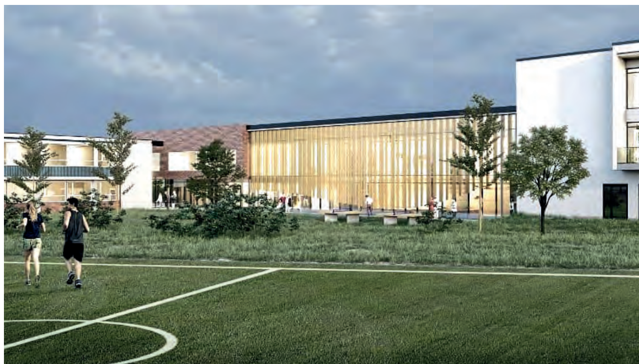
NYE TASTAVEDEN: Slik skal det se ut når skolen innvies i 2023. datategning tastaveden