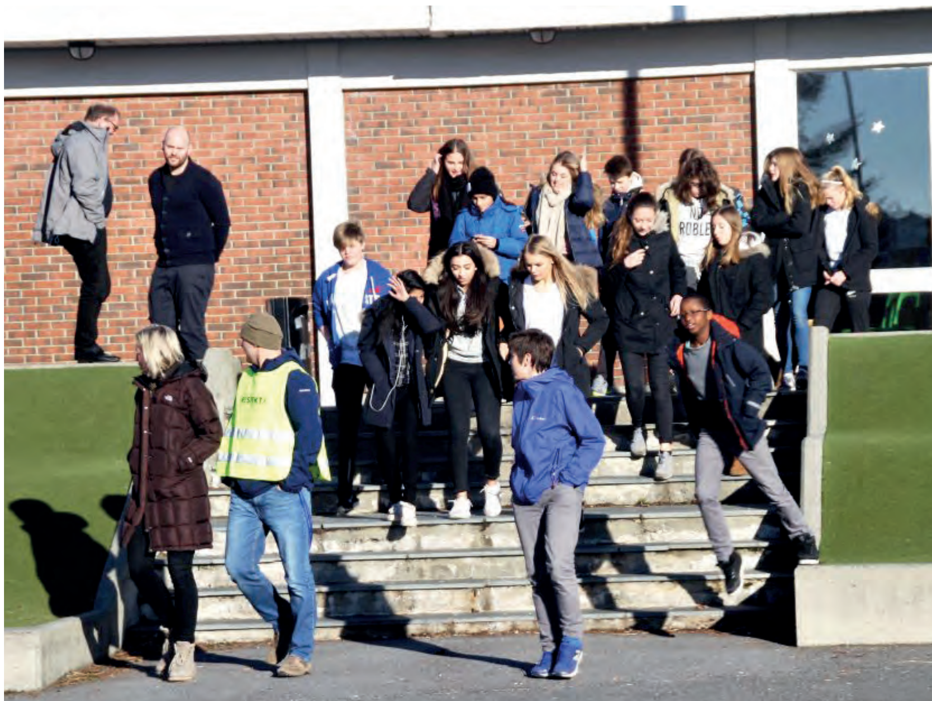
SAMSTEMT SKOLE: Elever, lærere, rektor, FAU – alle var enige når det kom til skolens framtid. tastaveden skole elever enige.

Hva: Kjempet for å få beholde og modernisere Tastaveden skole