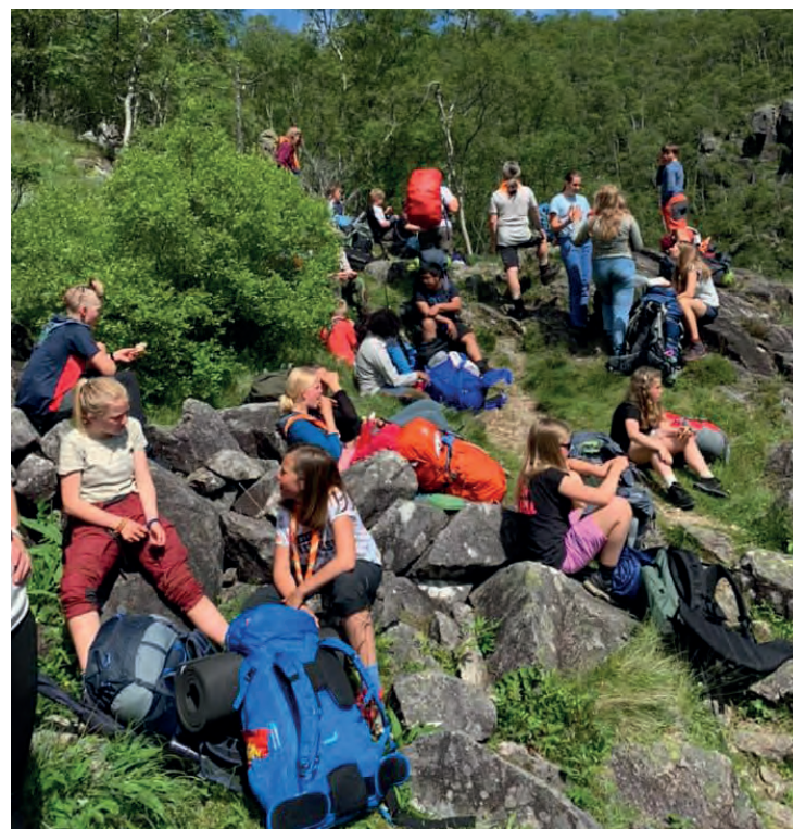
UTE I NATUREN: Her fra en av speiderturene til Tastaspæiderne