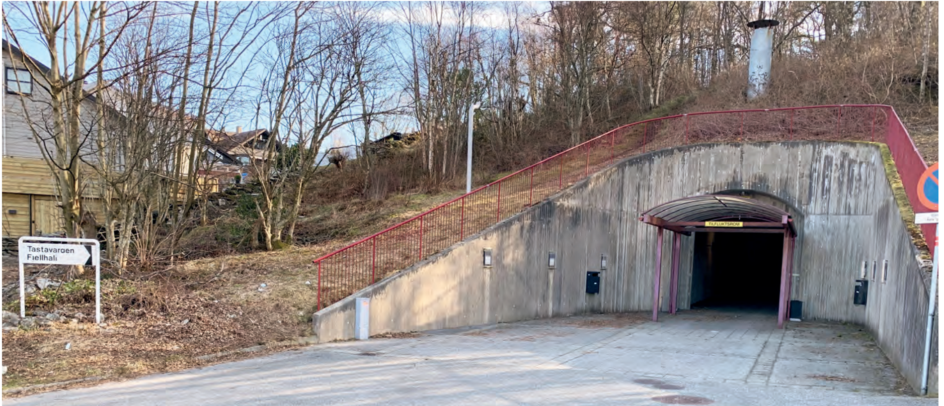
TASTAVARDEN FJELLHALL: I den siste tiden har flere nysgjerrige vært innom for å ta en titt på bydelens tilfluktsrom.