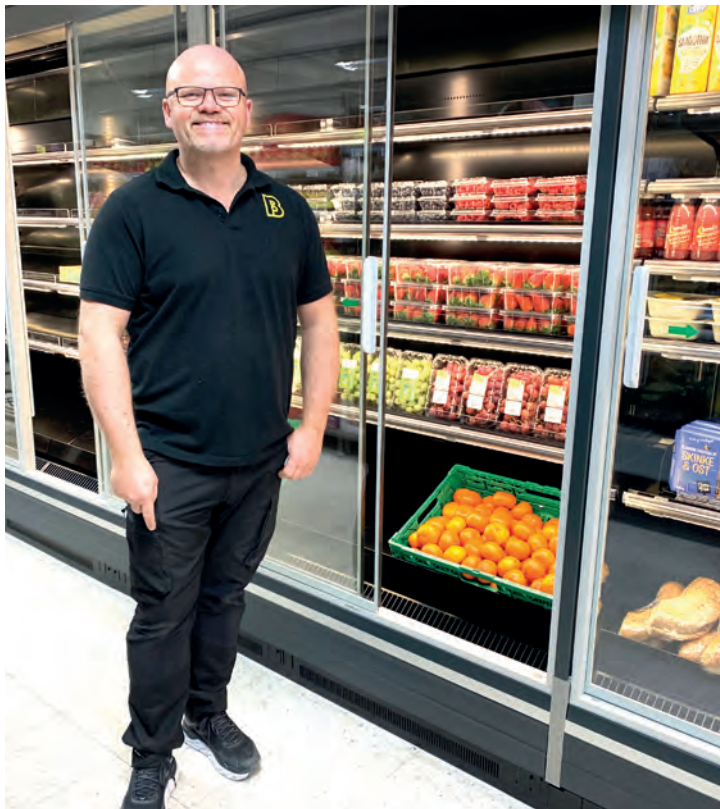
STOR FORNØYELSE: Den mest omfattende oppgraderingen er av kjøleanlegget, med ny teknologi og et stort estetisk løft.