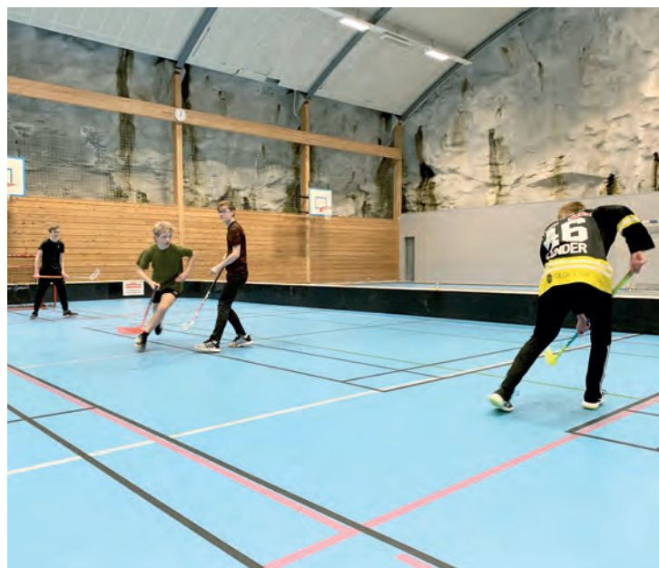
TRENING, IKKE TILFLUKT: Innebandylaget til Vardeneset Idrettsforening er blant de mange som bruker fjellhallen.

• «Offentlige tilfluktsrom» er beregnet for alle som bor i området eller tilfeldigvis oppholder seg der. Denne typen anlegg er som regel bygget i større byområder, store tettsteder og ofte lokalisert til sentrumsområdene. Man finner disse anleggene, som er merket med skilt på utsiden, i fjellhaller, parkeringsanlegg, kjøpesentre og annet.