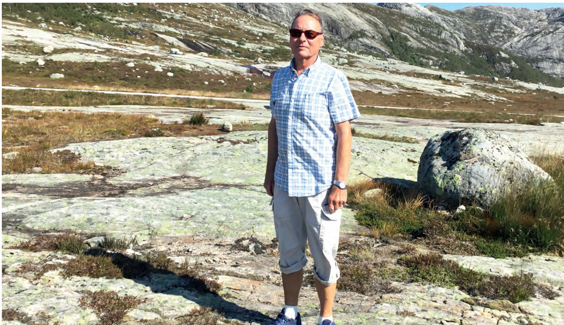
EN GLAD TURGÅER: Strålende sommerdag på Lyngsheia i Ryfylke.

Kommunedelsutvalget har ordet. I de kommende utgavene av Tastavis vil politikerne i Tasta kommunedelsutvalg fortelle hvilke saker de brenner for og hvordan de ønsker at bydelen skal være.