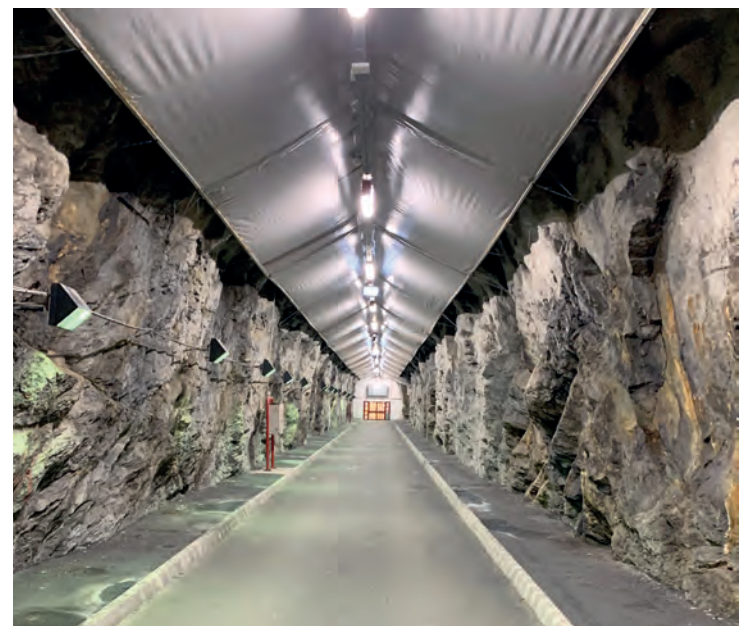
DYPT INNE I FJELLET: Fra den utvendige døren er det et par hundre meter inn til selve hallen.