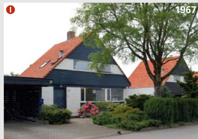
Fra 1950-tallet ble det bygget mange rekke- og kjedehus i Stavanger. Arkitektene Retzius & Bjoland tegnet i en årrekke slike hus i mange ulike utforminger. Stokkabrutene (1967) er ett av de mest særpregede og best bevarte feltene. Noen få av husene har fått mindre tilbygg, som ikke virker forstyrrende på den karakteristiske helheten. Kjedehusene har relativt store private hager mot vest.