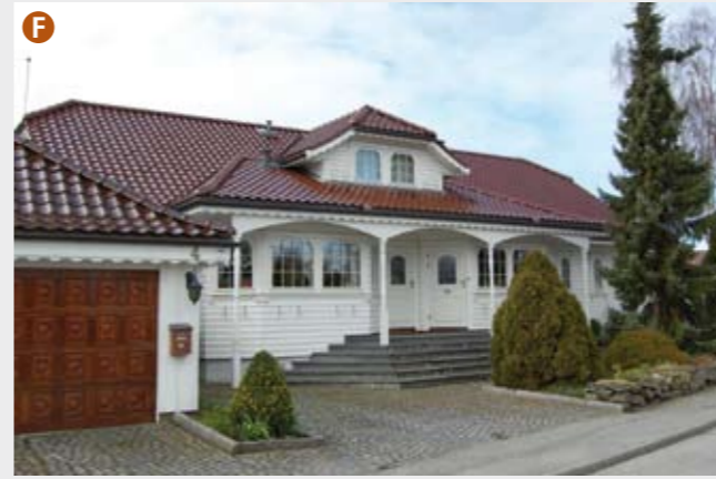
Vestre Stokkavei 4 (Trelastkompaniet i 1989) er en typisk eksponent for sin tid. Helt ned i detaljene er dette huset gjennomført i 1980-tallets postmoderne boligstil, som hentet inspirasjon fra både herskapsvillae og idylliske sørlandshus – samt amerikanske forbilder.