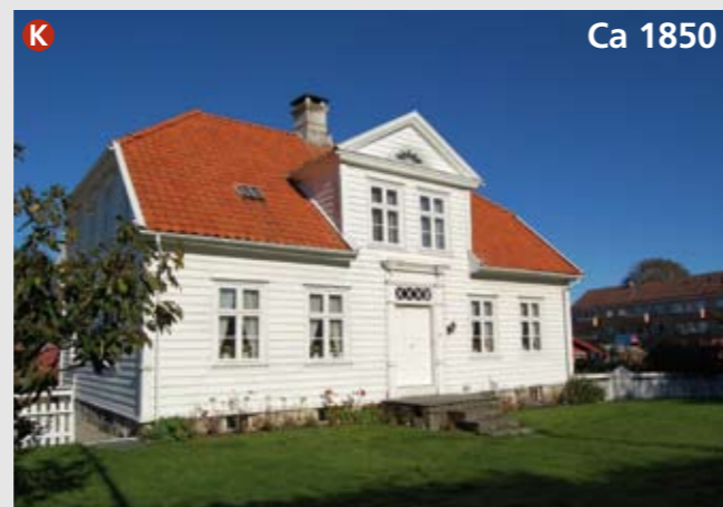
Stokkaveien 73, Bækkelund, er et fredet lyststed fra 1850-tallet. Huset er bygget i empirestil og er preget av symmetri og klassiske idealer. På byggetidspunktet lå anlegget for seg selv ute på landet. Nå er det helårsbolig og ligger i en sentral bydel. Bybebyggelsen begynte så smått å nå hit ut først rundt 1920. På baksiden ligger også en tjener-/forpakterbolig og en låve som er ombygd til bolig.