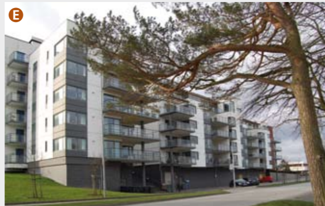
Langs "bysnittet" kan man avlese en kronologisk utbyggingshistorie, men bildet blir variert av at eldre gårdsbebyggelse ligger igjen i nyere bydeler, og at nyere "infillprosjekter" legges inn i etablerte områder. Her et leilighetskompleks fra år 2000 ved Aros arkitekter.