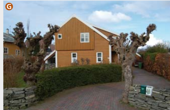
I Vestre Stokkavei 54 (Arkitektkontoret Vest, 1993) er det brukt mange elementer fra tradisjonell byggeskikk. Sammen med trærne ved innkjørselen, som står igjen etter gårdstunet som en gang lå her, gir dette et tidløst preg.