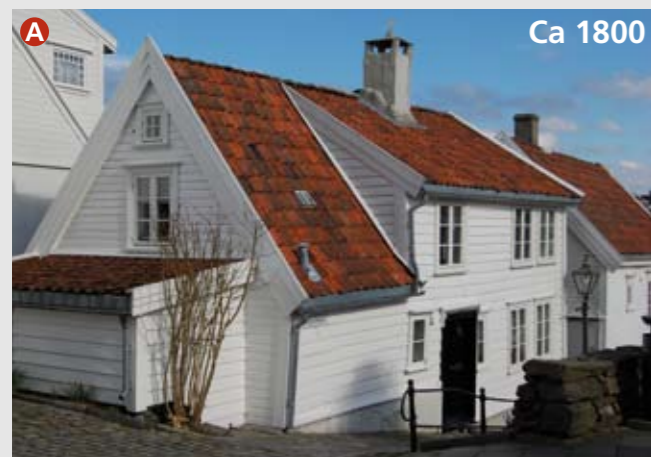
Andasmauet 5 er av ukjent alder, men er bygd etter 1768 og for 1846. Stilpreget er empire. I 1875 var dette bolig for 3 husstander. Huset er karakteristisk for den tette bebyggelsen i det vernede området "Gamle Stavanger". Verneplanen fra 1956 er en av landets eldste. I starten omfattet den bare 33 hus, men etter flere utvidelser er nå hele den gamle bebyggelsen på "Straen" inkludert. (Tils. 209 hus.)