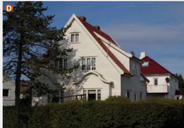
I krysset Holbergs gate og Steingata ligger tre vakre villaer fra ca 1930 bygget i jugend-/nyklassisistisk stil. Jugendstilen, med sine smårutede vinduer og rike ornamenter holdt lenge stand i Stavanger.