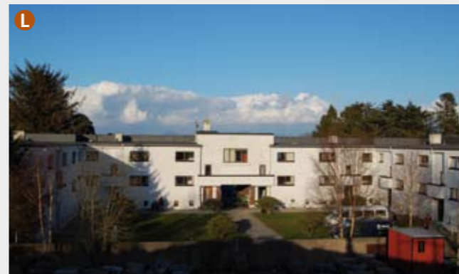
Sjømannshjemmet (ark. Waldemar S. Hansteen, 1932) tilhører den opprinnelige funkis-perioden som har inspirert dagens arkitekter. Det erstattet et eldre sjømannshjem i Gamle Stavanger. Det blir nå bygget om til små leiligheter med felles takterrasse.