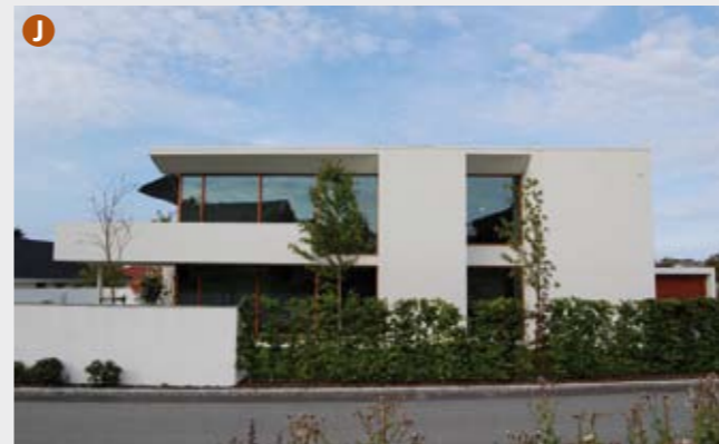
Gullregnstien 8 (arkitekt Tommie Wilhelmsen 2005), er ett av flere nye hus bygget på et tidligere gårdsbruk. Husene har ulik utforming og materialbruk, men mange er i "nyfunkisstil". Nr 8 er spektakulær i sin enkelhet og påkostede materialbruk.