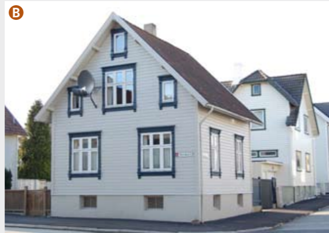
Sveitserstilen avløste empirestilen i de siste tiårene av 1800-tallet. Karakteristisk er synlige, utskårne bjelkeender under takutstikket og krysspostvinduer. Steingata 29 fra 1910 er et godt bevart eksempel.