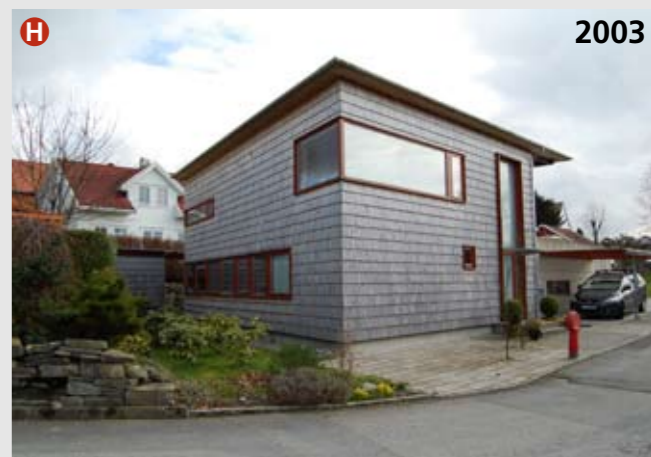
Stokkahagen 1 (arkitekt: Hoem og Folstad, 2003) er en representant for den nye funkis-bølgen som oppstod på 1990-tallet – men også for et gammelt håndverk: spontekking. Kledningen er av samme type som finnes på stavkirketakene. Den er laget av kjerneved og tåler å stå ubehandlet i mange år. Etter hvert som den blir utsatt for sol og regn, gråner den. Vindusdetaljer i mørkere treverk gir en vakker kontrast.