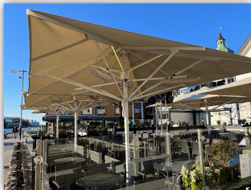
Parasoller som er tilpasset uteserveringen

Faste tak som over uteserveringen er søknadspliktig etter Plan- og bygningsloven og vil normalt ikke bli tillatt foran bevaringsverdige bygninger.