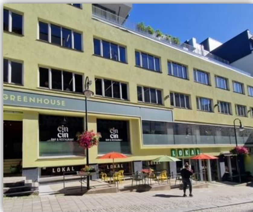
Platting som er støpt

Platting skal alltid være universelt utformet.