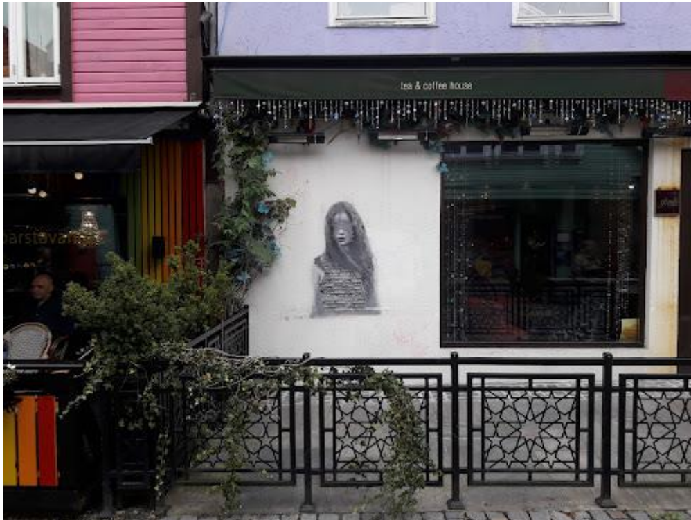
Gjerde som er festet i bakken

Enkelte steder kan det være behov for å feste gjerder, skjermer eller parasollføtter i grunnen. Stavanger kommune kan i enkelte tilfeller gi tillatelse til dette.