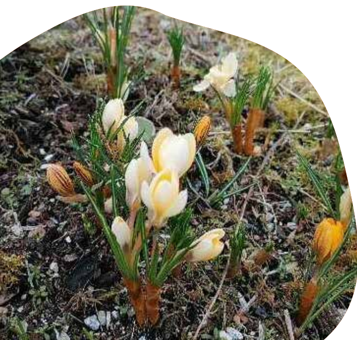
Til venstre: Krokus er løkblomster som ikke er giftige, er bra for pollinerende insekter og som kan skape fin årstidsvariasjon. Det kan gi gode opplevelseskvaliteter på lekeplasser.