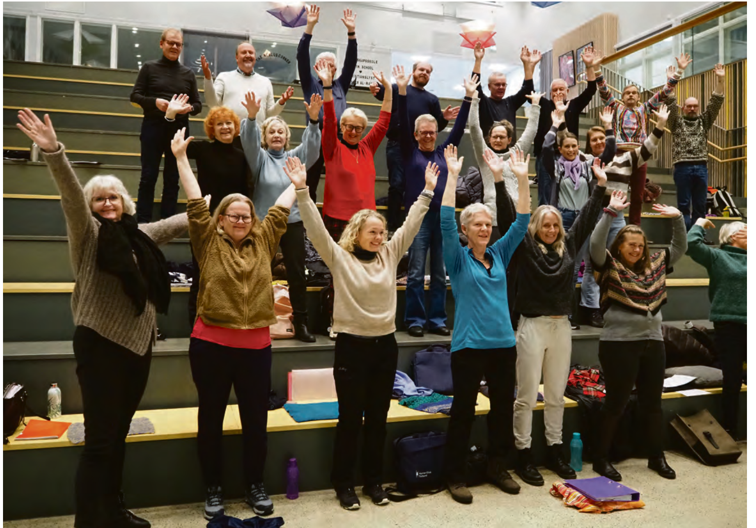
OPPVARMING: Blandakoret Humus varmer opp stemme og kropp. Snart får vi høre de vakreste sanger på Kristianslyst Skole.