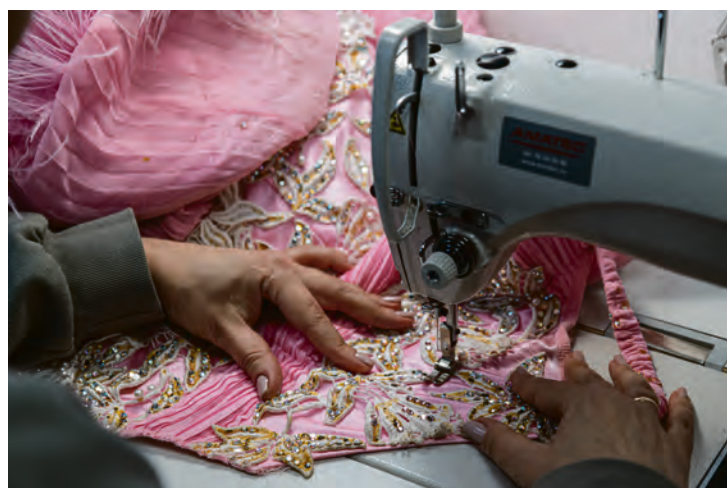
VARIERTE OPPDRAG: Perler, paljetter og tyll.