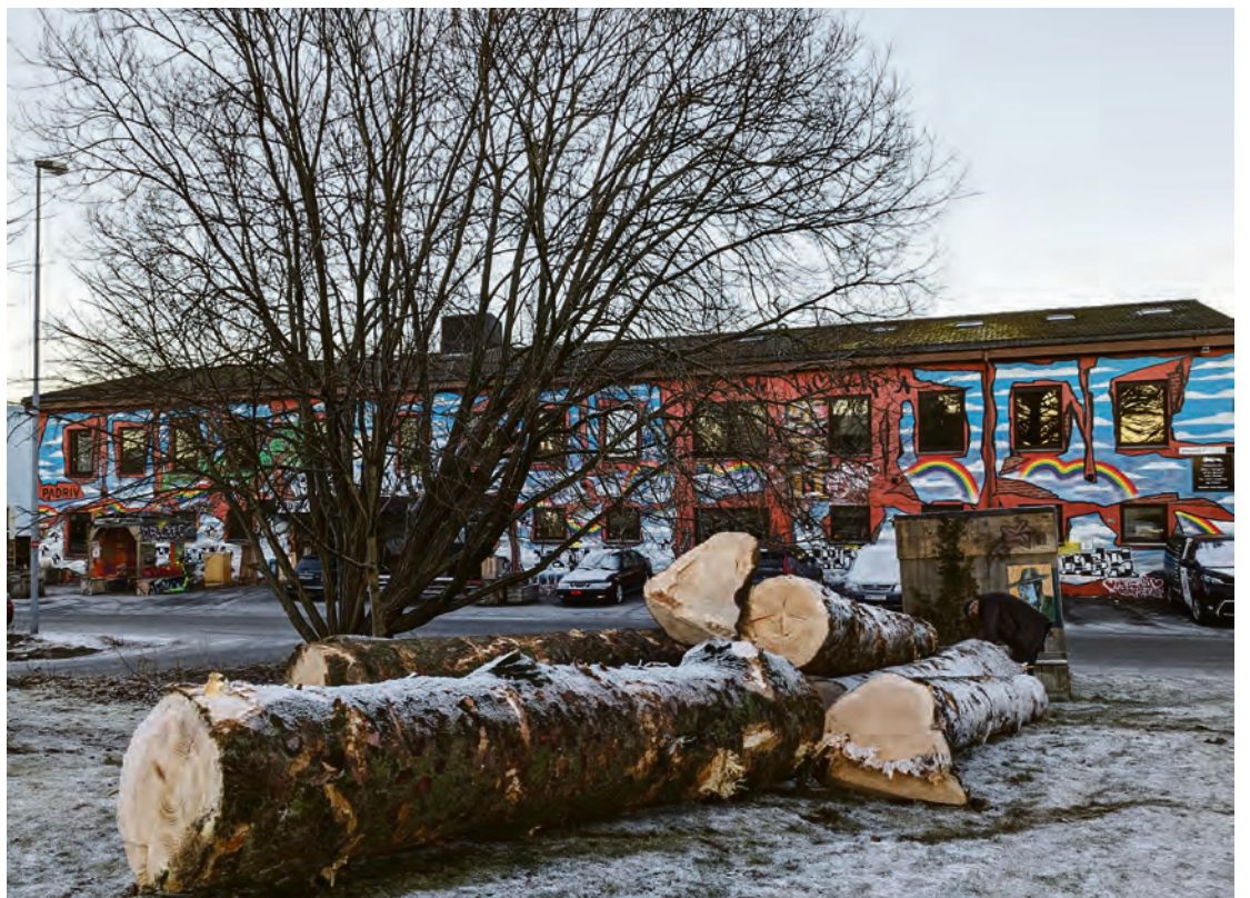
GJENBRUK: Disse trærne skal på sikt bli utemøbler.

Det har vært rettet kritikk mot kommunen som i januar fjernet flere større grantrær i forbindelse med oppstarten av prosjektet. - Mye av det arbeidet som må gjøres under jorden kom i konflikt med røttene til disse trærne og det ble dessverre vanskelig å beholde alle sammen, sier Bastlid. - Vi har konsultert arborist som mente at trærne var både gamle og til dels syke og ved å