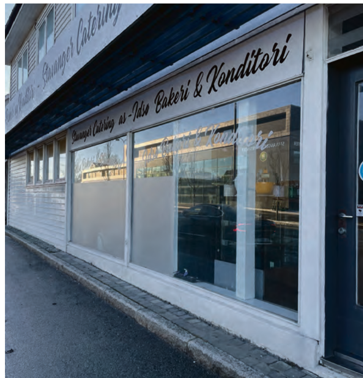
KONDITIONET: Bak disse vinduene foregår baking og matlaging. Det er bare å bestille!

Det kjekkeste med baking er at det gir rom for kreativitet, mener Erling. - Gjærdeig og surdeig er levende. Når man lager en deig, settes det i gang prosesser og det blir et resultat. Bakeren kan kjenne