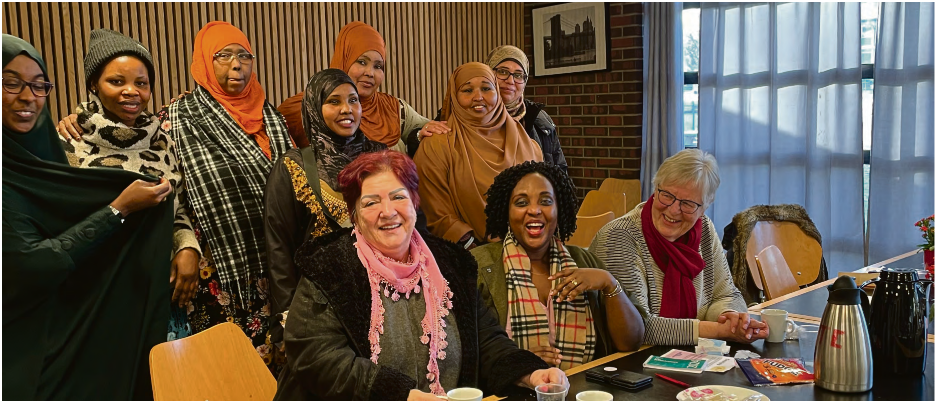
GLAD GJENG: Her er den glade gjengen fra Språkkafe i Bekkefarene Bydelshus. Her snakker man bare norsk.