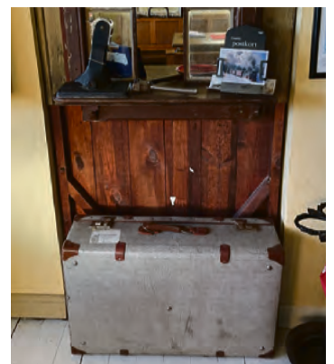
GJENGLEMT?: Har noen glemt igjen kofferten her?