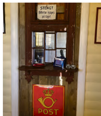
INTERIØR: Litt av interiøret i bygningen