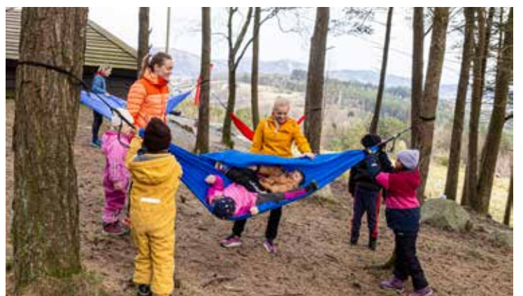
FULL FART: Hengekøyene skapte liv i leiren!