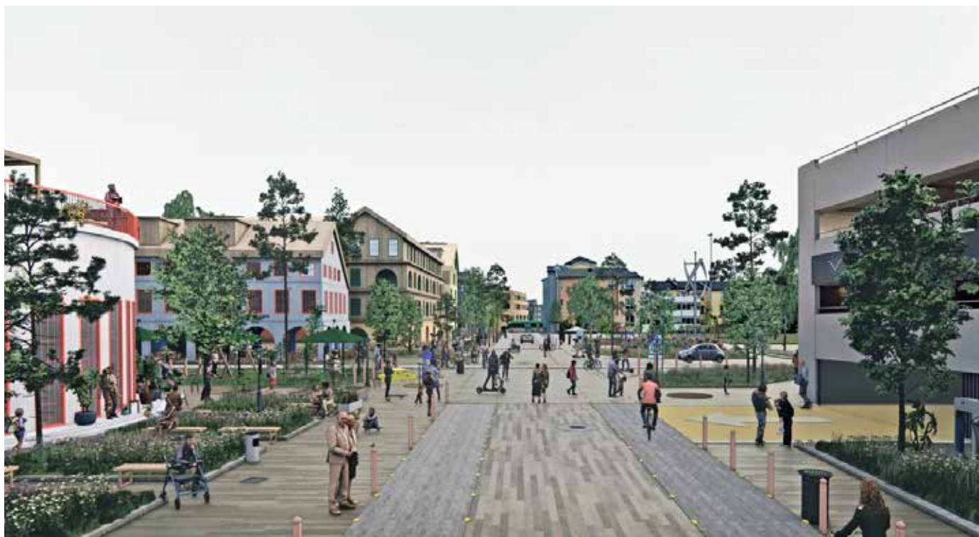
NYTT TORG: «Vi savner kaféer, torghandel, mer grønt og sitteplasser».