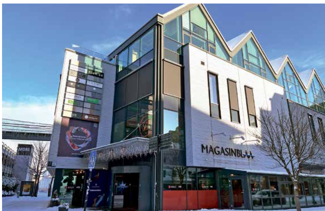
Klinikken holder til i 3. etasje i MagasinBlaa.