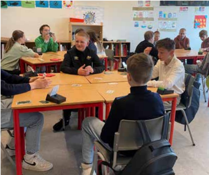
KONSENTRASJON: Her er klassen i full konsentrasjon. Bridge er gøy!

Bridge er et kortspill for fire spillere der to og to spiller sammen som par. En vanlig kortstokk på 52 kort brukes. Alle kort deles ut. Hver spiller får da 13 kort. Vi har trodd at dette er underholdning og tidtrøyte for pene mennesker i de øvre samfunnslag. Nå vet vi at spillet er mye mer enn det.