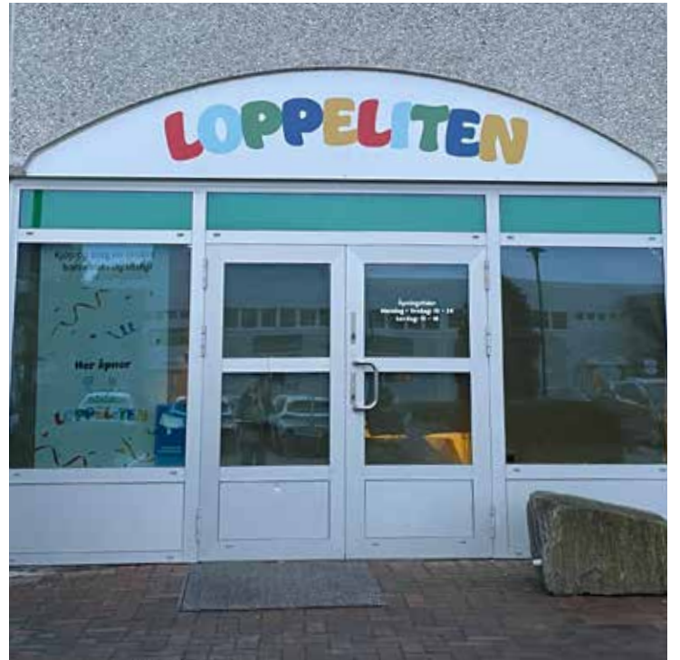
VELKOMMEN TIL LOPPELITEN I HILLEVÅG: Her finner du et stort utvalg av klær og leker.

– Dette er min nye yndlingsbutikk, sier en kunde som tar seg tid til å prate med oss under en pause på stellerommet. Hun er her hver uke. Det er lett, for hun bor i nærheten. Hun selger det hun ikke bruker lenger. Hun kjøper også, og sier hun liker å se og kjenne på det hun skaffer seg. Oppdateringer på utvalget finner hun på sosiale media. Det er greit at både klær og utstyr, bøker og leker, er på samme sted. At det også fins et