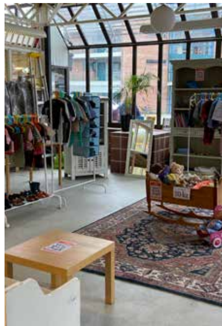
GODT UTVALG: Mye å velge i her!