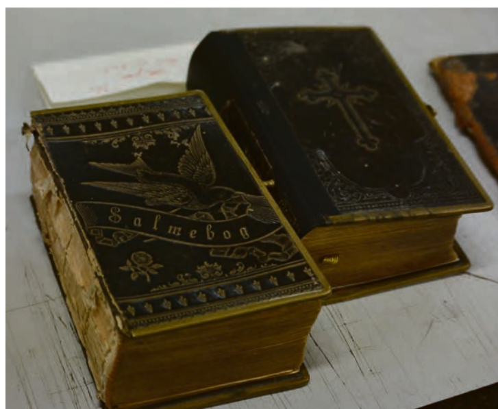
GAMLER BØKER: Disse to er inne for restaurering.