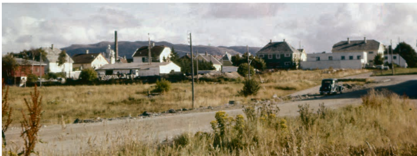
I dag er dette området atskillig mer trafikkert enn det en gang var. Husker du hvor det var? Svaret kommer i hvert fall i neste nummer.