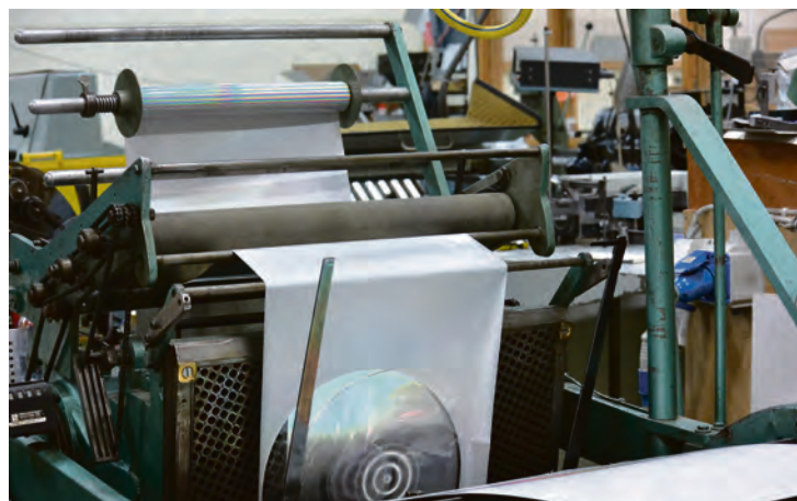
MASKINER: Litt av hvert å se her!