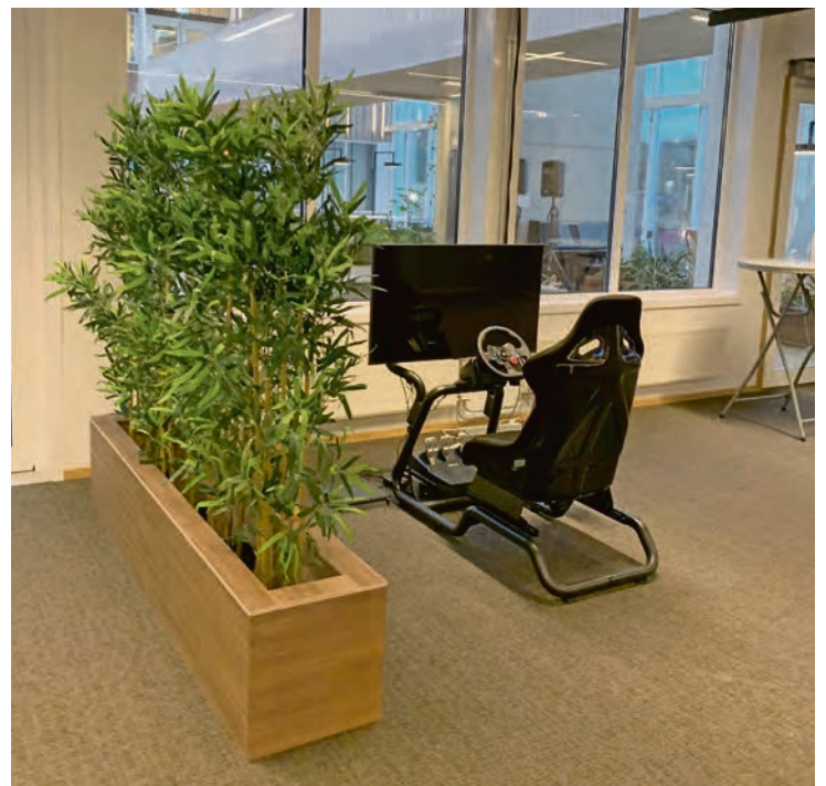
GAMESTOL PLANTE: Her kan du game med busker og atrium utsikt.