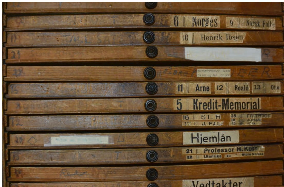
HYLLER: Her er det orden og system.