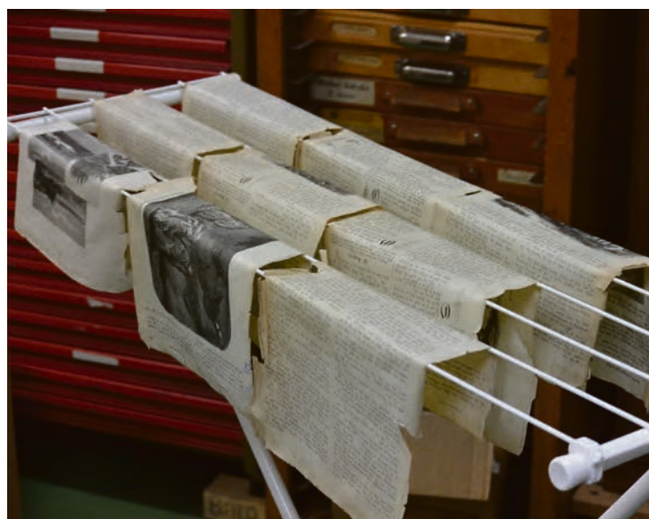
TIL TØRK: Slik er det greit å tørke papir.