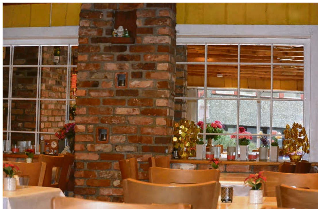
God mat smaker enda bedre i fine omgivelser