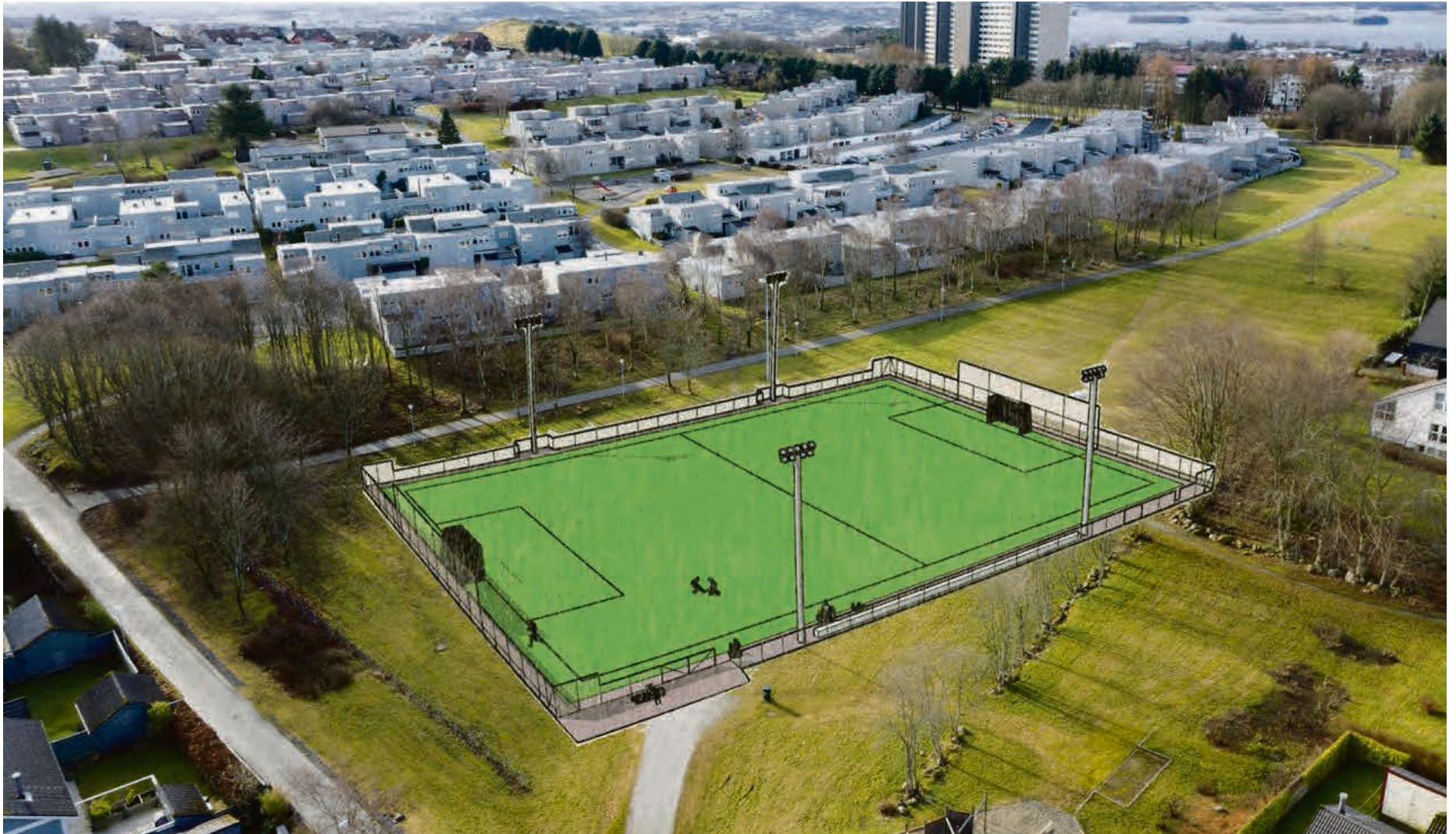
KUNSTGRESS: Haugtussa kan få ny kunstgressbane.