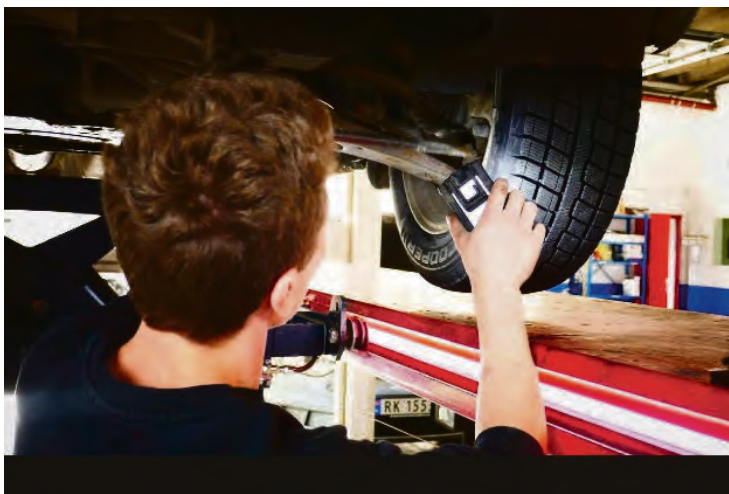
BILLSJEKK: Nøysom bilsjekk hos Nevlands.