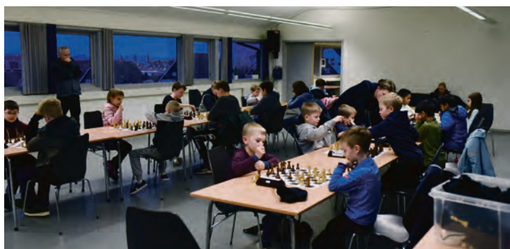
POPULÆRT: Det pleier å være rundt 20 barn og unge som spiller sjakk på Tjensvoll om onsdagene.

Det finnes blant annet tre onlinegrupper, i tillegg til fysiske turneringer og større arrangementer, og som medlem kan du delta på klubbens arrangementer så mye du vil.