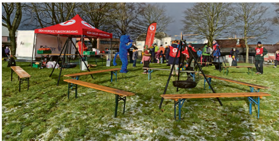
STEMING: God stemning med aktiviteter i Kvalbergparken