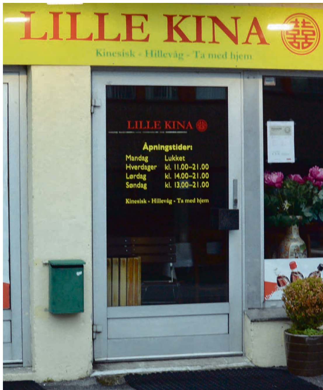
Kina i Hillevåg.