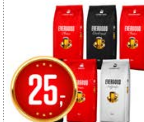
EVERGOOD KAFFE 250 g pr. pk 100.00 /kg