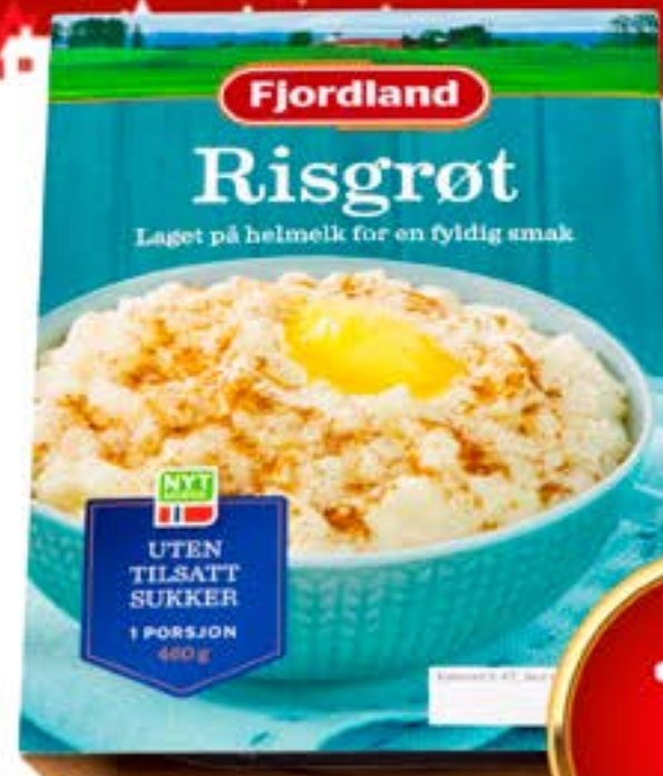
RISGRØT 460 g Fjordland pr. pk 21.74 /KG