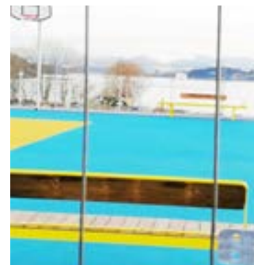
Ballfeltet er bygget av Bane Nor Eiendom.