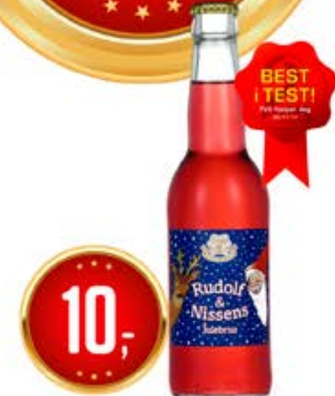
RUDOLF & NISSENS JULEBRUS 0.33 l Oskar Syltepr. stk 30.30 /L