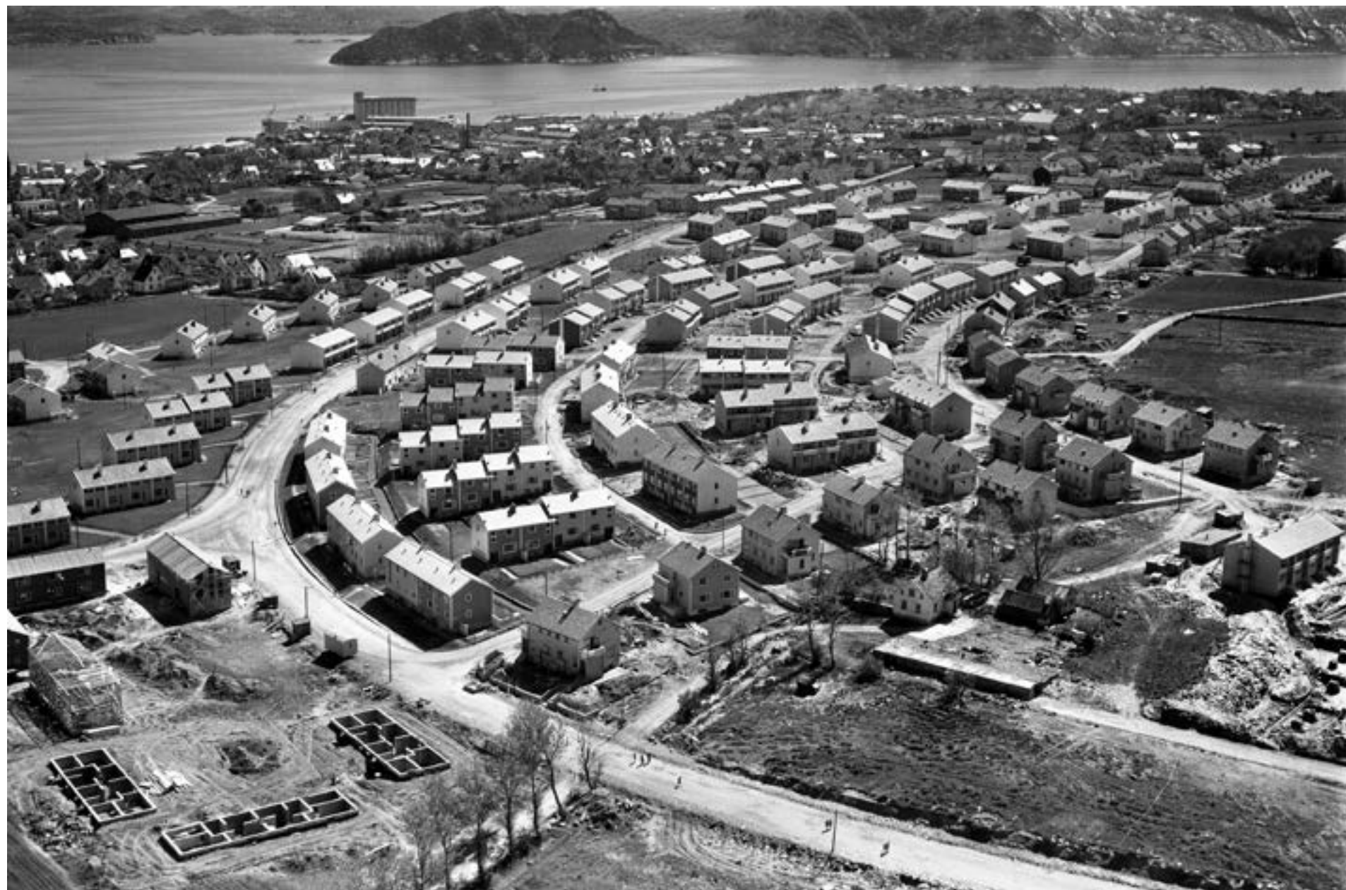
Rekkehusbygging i Bekkefaret 1957. Hovedveien er Oscar Wistings gate og Svend Foyns gate.