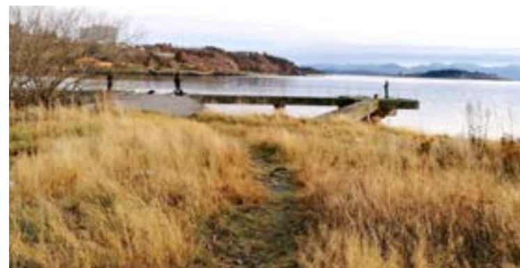
En velbrukt sti ned til kaien.