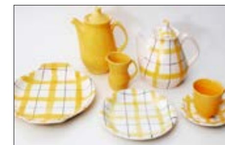
Smørgås, dekor Inger Waage 1956-68.