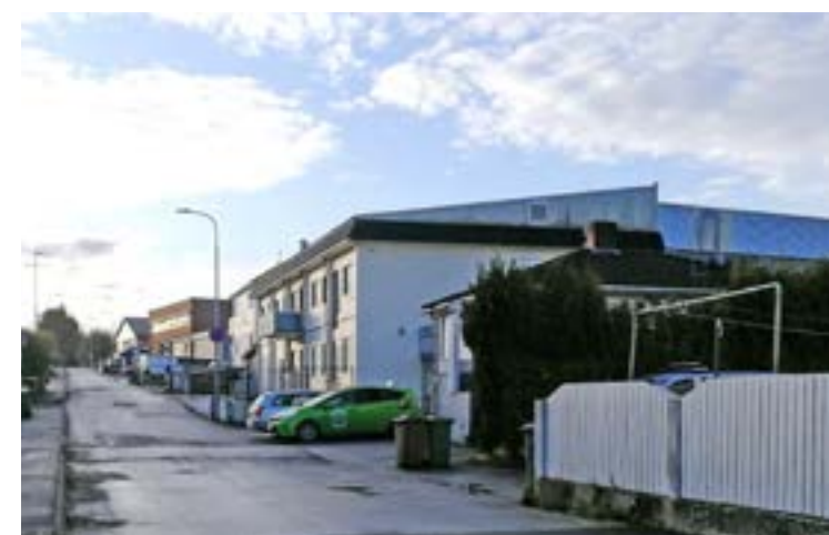
Det var stille i Bergsagelveien tidlig en søndag morgen i november. Hverdagen har vært preget av varierende trafikkmessig kaos med graving, stengning, omkjøringer, manglende fortau, mange biler, bakkende biler og trailere kombinert med syklende og gående barn og voksne på vei til og fra bolig, barnehage, skole, moské, bryggeri og andre arbeidsplasser. Alt kan bare bli mye bedre!

Lyse informerer om at arbeidet vil føre med seg noe støy og stengte veier. Beboere skal fortsatt ha adgang til sine eiendommer. Berørte fortau og gangveier kan midlertidig bli lagt om. Omlegging av trafikk vil bli skiltet. Anleggsarbeidet kan føre til at hager, gjerder, trær, murer og annet kan bli berørt eller må fjernes. Dersom dette skjer, vil