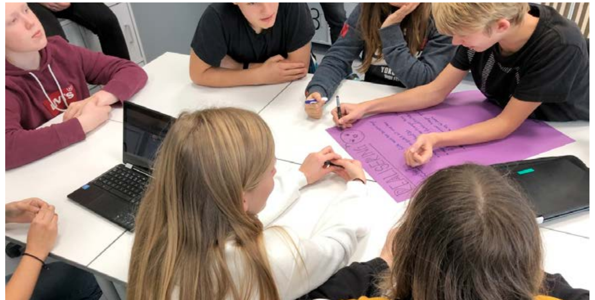
Ungdom i arbeid.