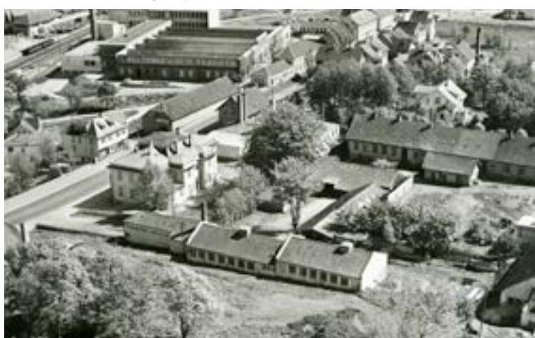
Omkring første verdenskrig inntok hermetikkfabrikkene Köhleranlegget. Pipene forteller oss at tiden som herskaps- og gårdsdrift er forbi.

auere, melkevogner og ølvogner. Dette var flotte vogner av god kvalitet, men det viste seg at han hadde produsert for lager og at han brant inne med mange.