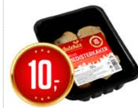
KLØVER MEDISTERKAKER 200 g pr. pk 50.00 /KG