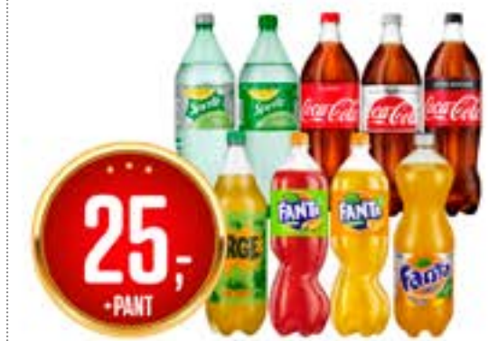
COCA COLA/ SPRITE/ FANTA/ URGE 1.5 l - pant 14.29 /L