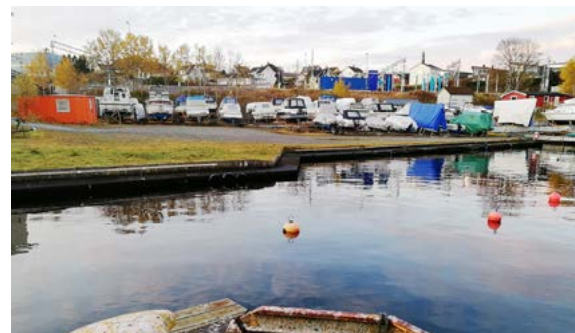
Her finn du byens truleg minste båtforening, med eit lite, raudt klubbhus (til høyre).

Båt plass i bøye og landfeste passar best for motor- og segl-