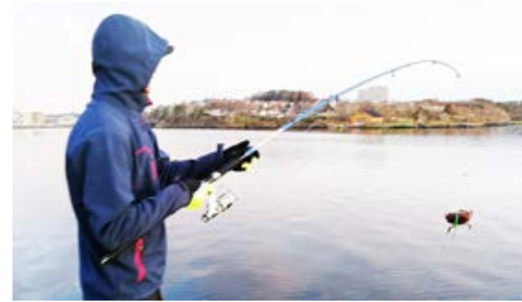
De fikk mest krabber.