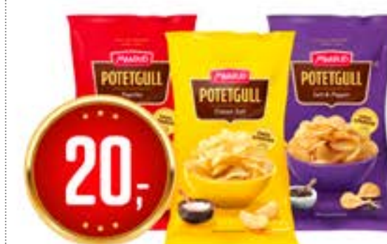
POTETGULL CLASSIC SALT, PAPRIKA OG SALT OG PEPPER 240 g/250 g Maarud pr. pk 80.00 /KG