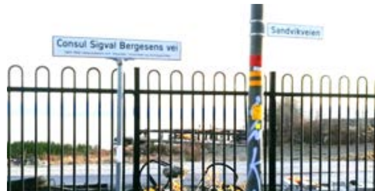
Store deler av sjolinjen er stengt for ferdsel.

Fra HILLEVÅG En sosio-kulturell stedsanalyse (2018) utført av IRIS og Universitetet i Stavanger på oppdrag fra Stavanger kommune. Les hele analysen på www.stavanger.kommune.no/hillevaag .