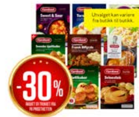
UTVALGTE MIDDAGER FRA FJORDLAND Fra 350 g