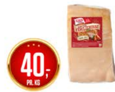
GILDE FAMILIERIBBE AV SVIN ca 3 kg rutet m/svor fryst pr. kg