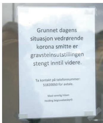
STENGT: Men gravsteinsutstillingen er stengt inntil videre.