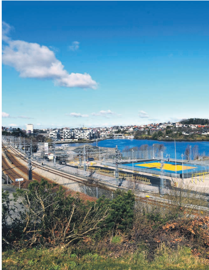
DAG: Slik ser området ut i dag. Bildet er tatt fra «Kvalen» som er en knaus på andre s

Hvordan den videre rensingen av sjøbunnen skal skje skal kommunen finne mer ut om mens planarbeidet pågår og før området opparbeides. Kommunen vil undersøke hvilke tiltak som må gjennomføres for at folk skal kunne ferdes trygt og hvordan man kan tilrettelegge for bading.