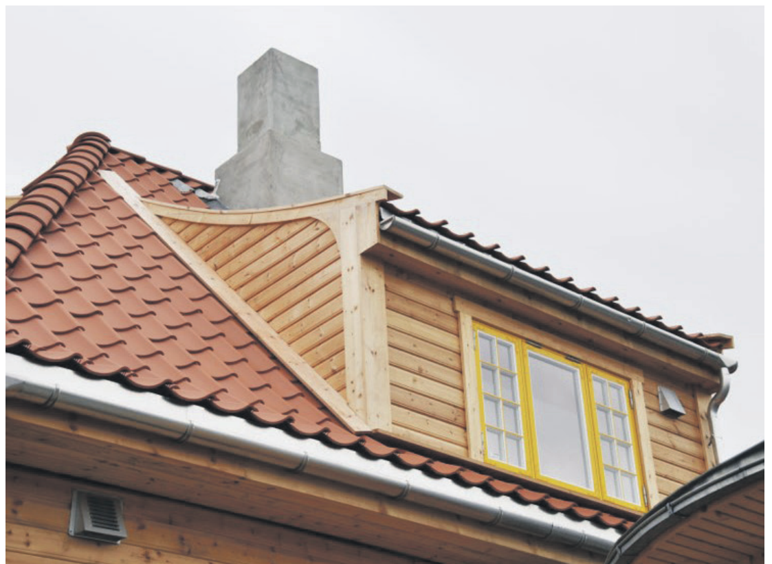
JUGENSTIL: Detaljer i tydelig jugendstil på huset i Køhlers vei 31.

Stavanger Jushinkan aikido kr 5 000 Bekkefarete bydelshus kr 10 000 Kvaleberg skolekorps kr 30 000 Uburhedleren KFUK-KFUM-speidere kr 30 000 Auglend og Tjensvoll skolekorps kr 30 000 Islamsk opplæringscenter kr 20 000 Hinna Håndball kr 3 000 Tjensvoll kirke dagsenteret kr 3 000 Almaz Eritreisk Ungdomsklubb kr 5 000 Brack ungdomsklubb kr 15 000 Tilskudd gitt til reiser som ikke gjennomføres vil bli vurdert. Hele innstilling og vedtaket er på kommunens nettside, se formannskapets møte.