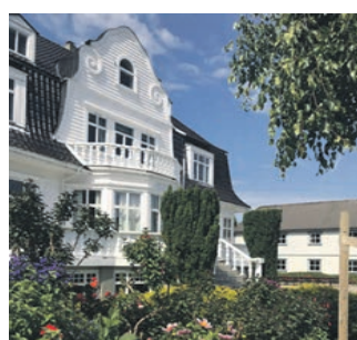
Tjensvollveien 44, 4021 Stavanger tlf: 940 50 930