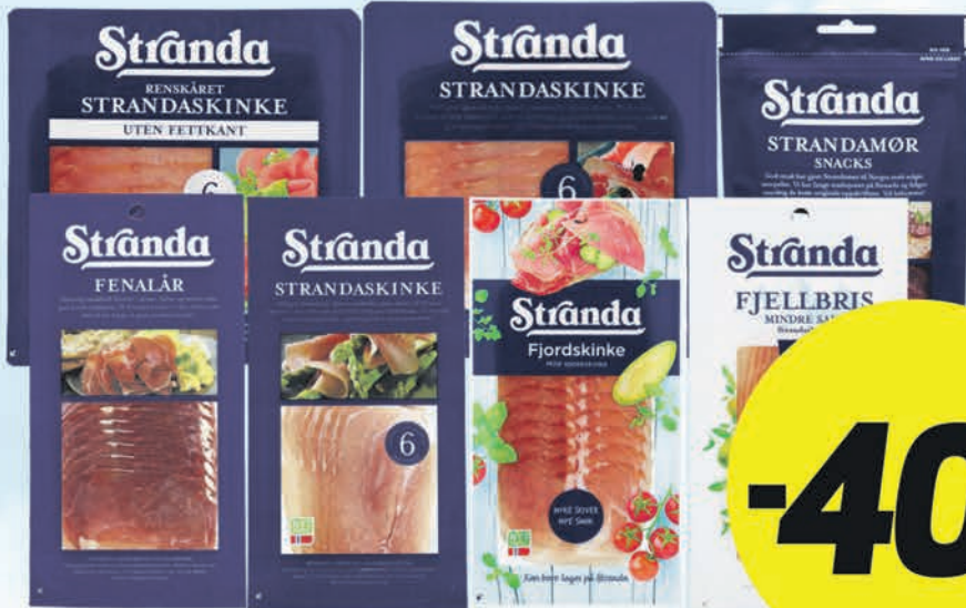
STRANDA SPEKEMAT Fra 70 g pr. pk