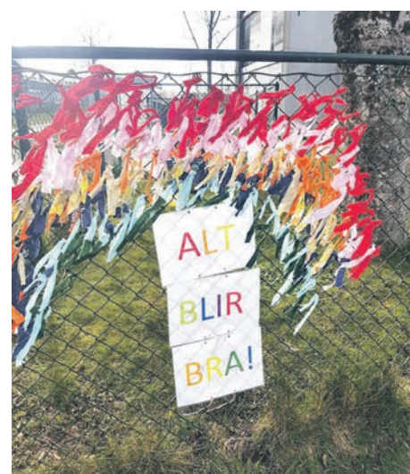
ALT BLIR BRA: På gjerdet ved Auglend barnehage.

Vil du ta bilder for Hillevåg & Tjensvoll Avis? Send noen bilder og noen ord om deg selv til: Hillevag-TjensvollAvis@outlook.com.