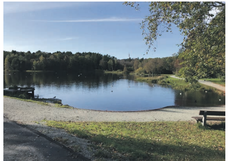
VANNASSEN: Foto Marit Storli.

Når det gjelder områder som folk synes er ekstra fine