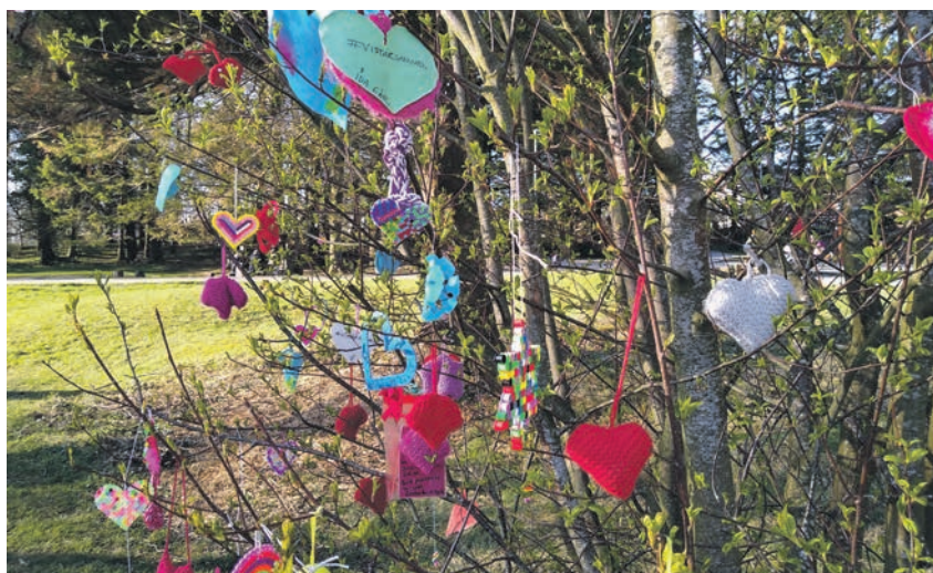
FARGERIK: I Vannassen henger hjertes og gode ord i trær og busker.

Utdrag fra kronikk av Sissel Fuglestad Askeland (Ap) som er varamedlem i kommunestyre, utvalg for by- og samfunnsutvikling og Hillevåg kommunedelsutvalg