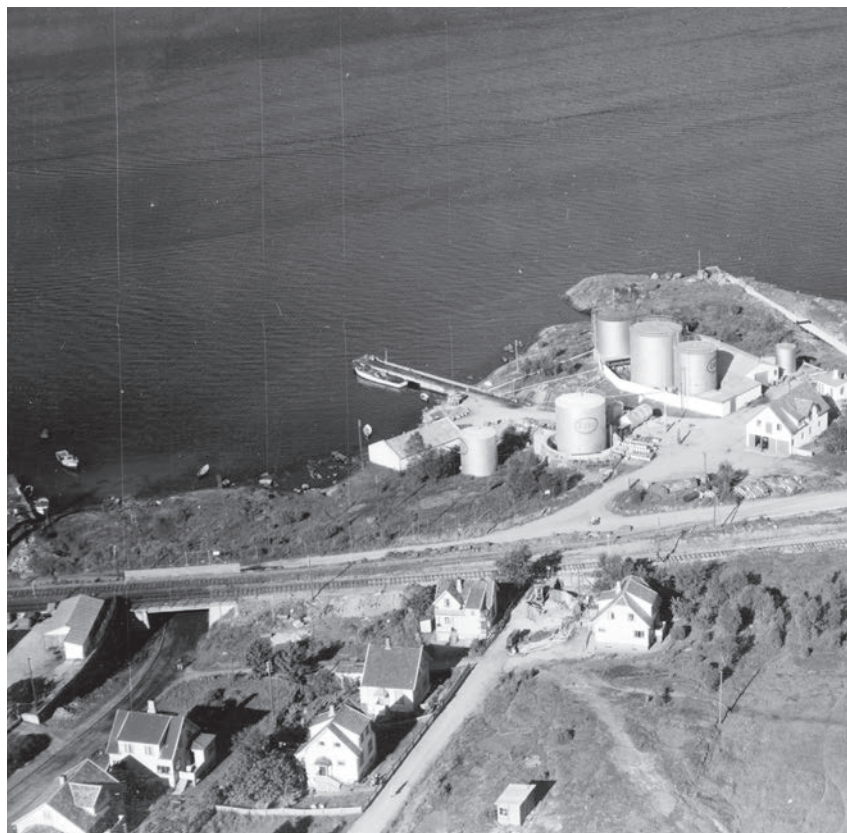
1949: Slik så det ut her i mange år mens Esso hadde tankanlegg.