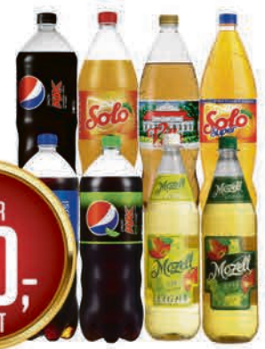
PEPSI, PEPSI MAX, SOLO, SOLO SUPER, VILLA OG MOZEL 1.5 l + pant