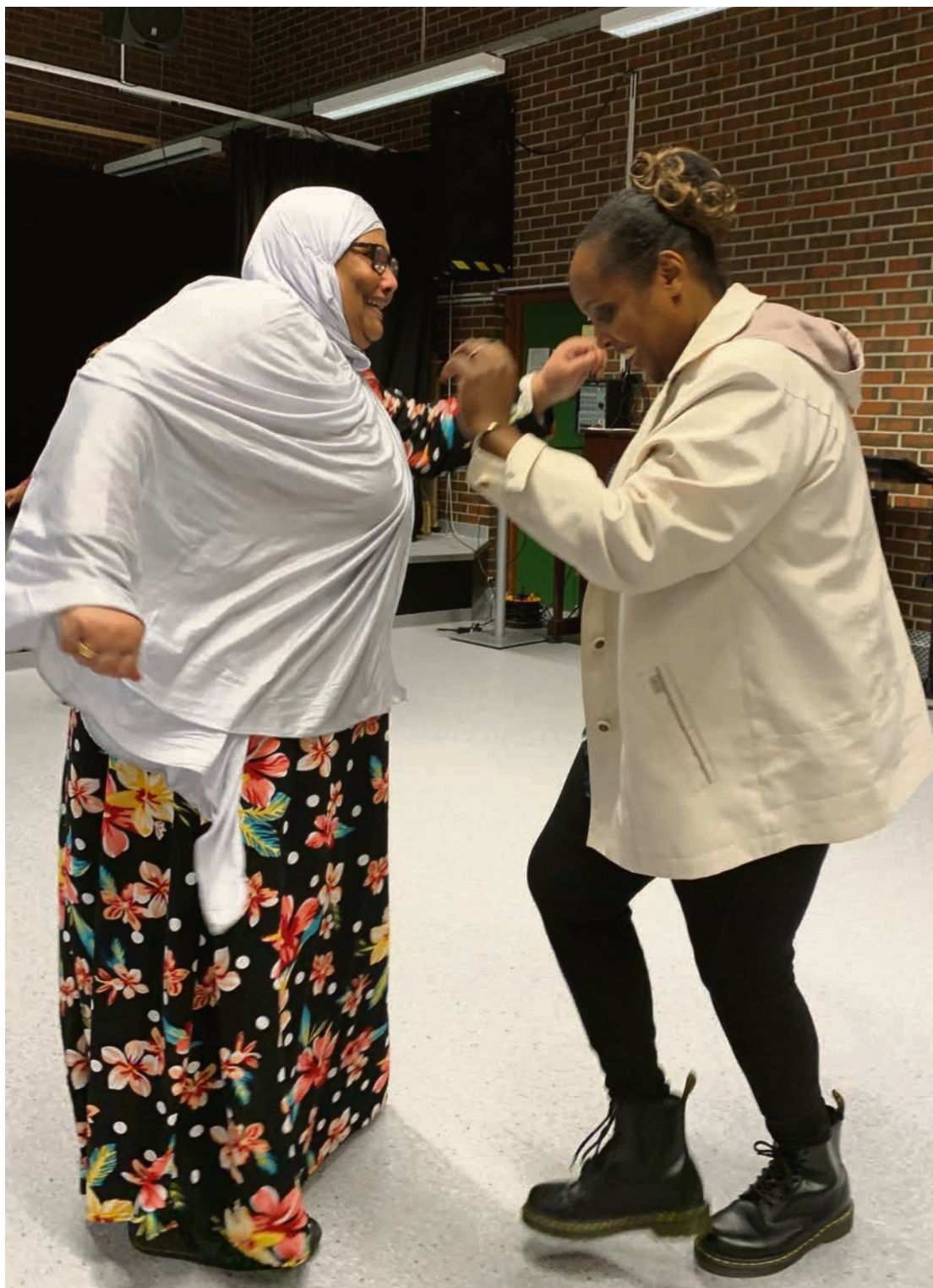
DANS: Duo danse oppvisning til trampeklapp

Disse erfaringene ønsker hun å bringe videre til andre i tilsvarende situasjon gjennom ulike lavterskeltilbud i organisasjonen.