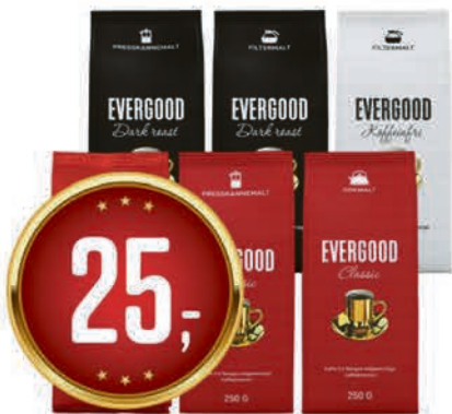
EVERGOOD KAFFE 250 G pr. pk 100.00 /kg