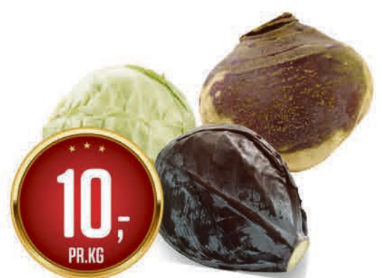
HODEKÅL, RØDKÅL OG KÅLROT pr. kg