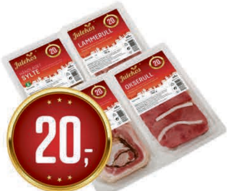
KLØVER JULEPÅLEGG Fra 80 g Ribberull, Lammerull, Sylte håndlaget og Okserull pr. pk 250.00 /KG