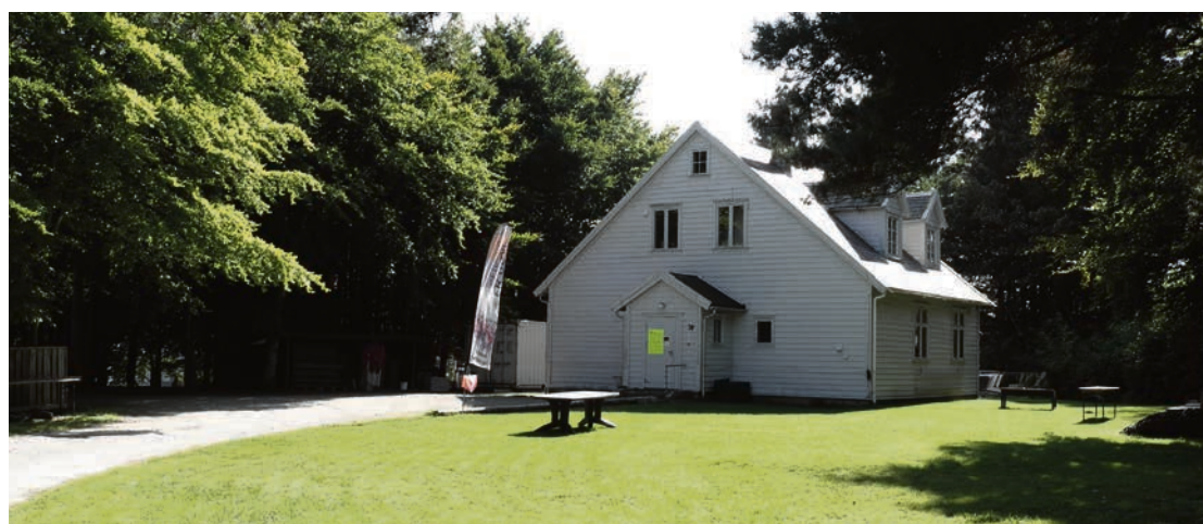
TOMT: Speiderhuset på Tjensvoll - uten speidere - for de var på kanotur i Store Stokkavatnet.