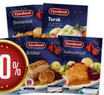
UTVALGTE MIDDAGER FRA FJORDLAND Fra 425 g pr. pk