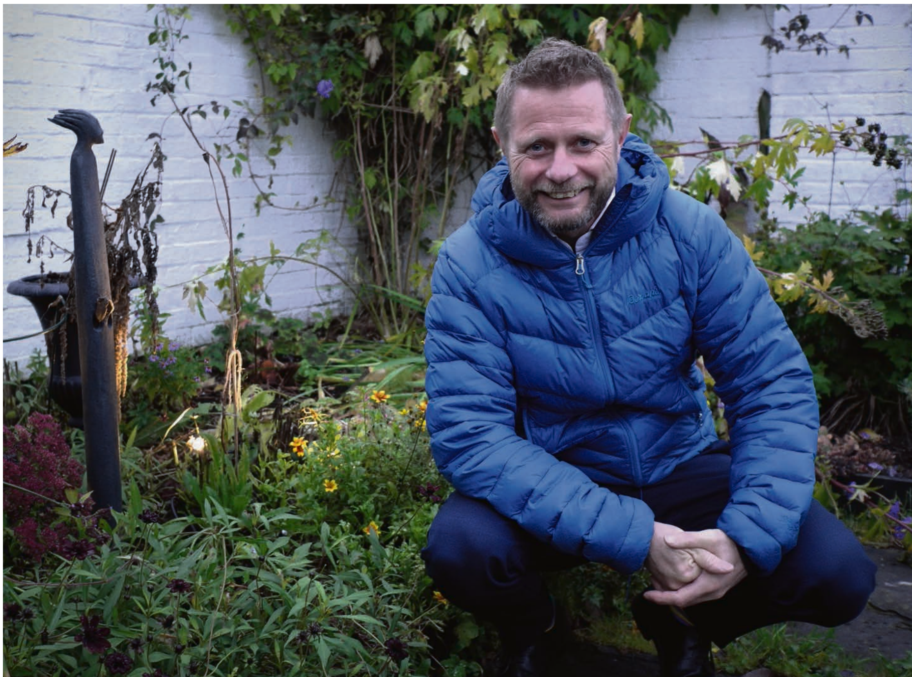
HILLEVÅGSGUTT: Det er nok en tilsnikelse å kalle statsforvalter Bent Høie for Hillevågsgutt, all den tid han er fra Randaberg. Men han bor på Auglend, og trives i hagen som selv i november har vakre elementer.

synspunkter i fylkestinget, synspunkter som Arne Rettedal ikke delte. Men, det er nok politikere i Rettedals egne rekker som er blitt langt verre overhøvet av Rettedal enn det Bent ble. Rettedal så også talentet til Bent, sier Leif Johan Sevland.