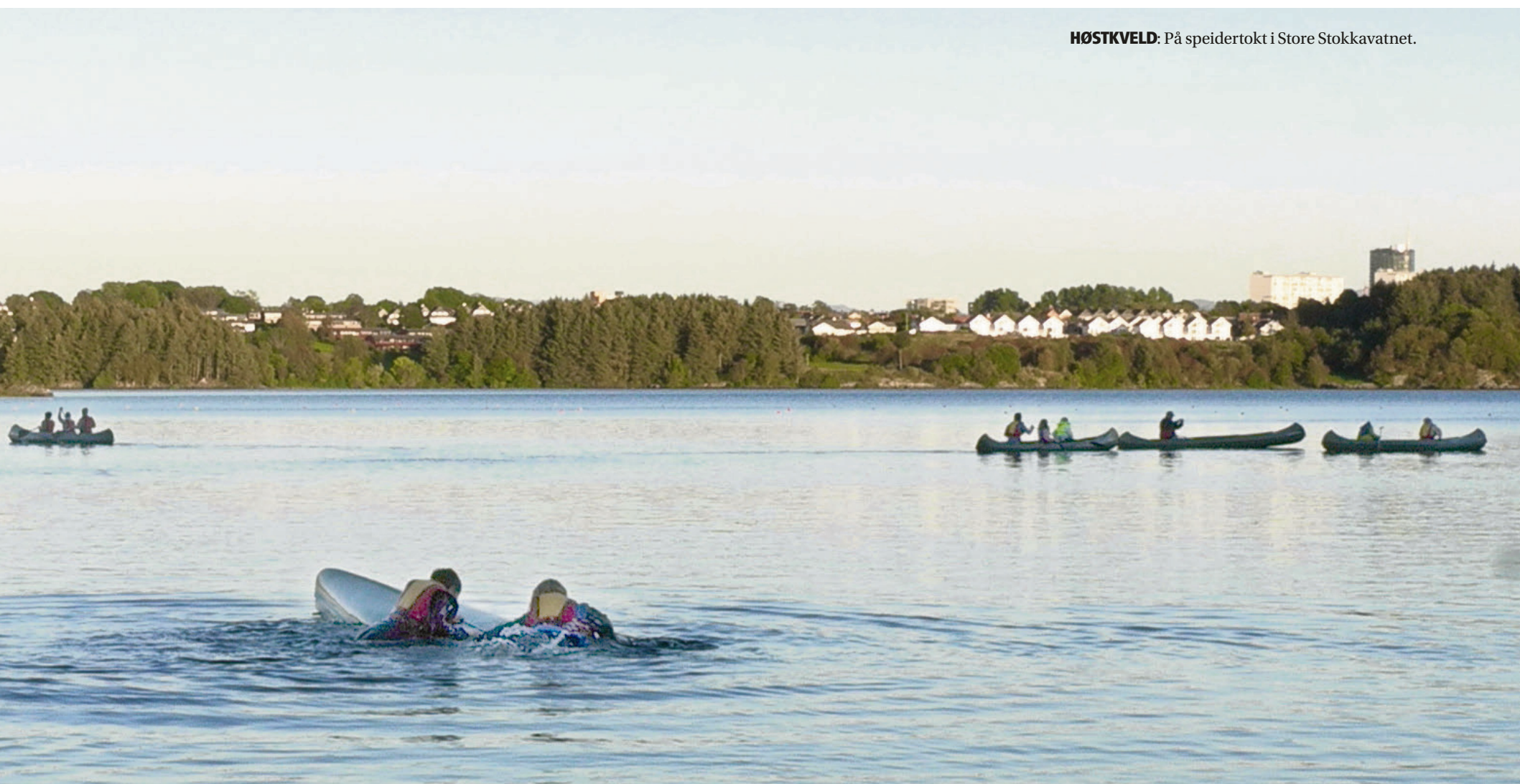
HØSTKVELD: På speidertokt i Store Stokkavatnet.