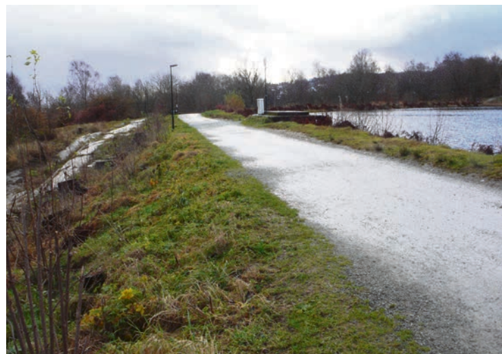
DEMNING: Veien ligger de to demningene som ikke holder mål. Demningene skal forsterkes på begge sider, og steinmassene vil danne en slak bakke ut i vannet.

Avløpsvannet skal ledes ut av Vannassen slik at det renner ned over berget mellom de to demningene, og videre i en åpen bekk.