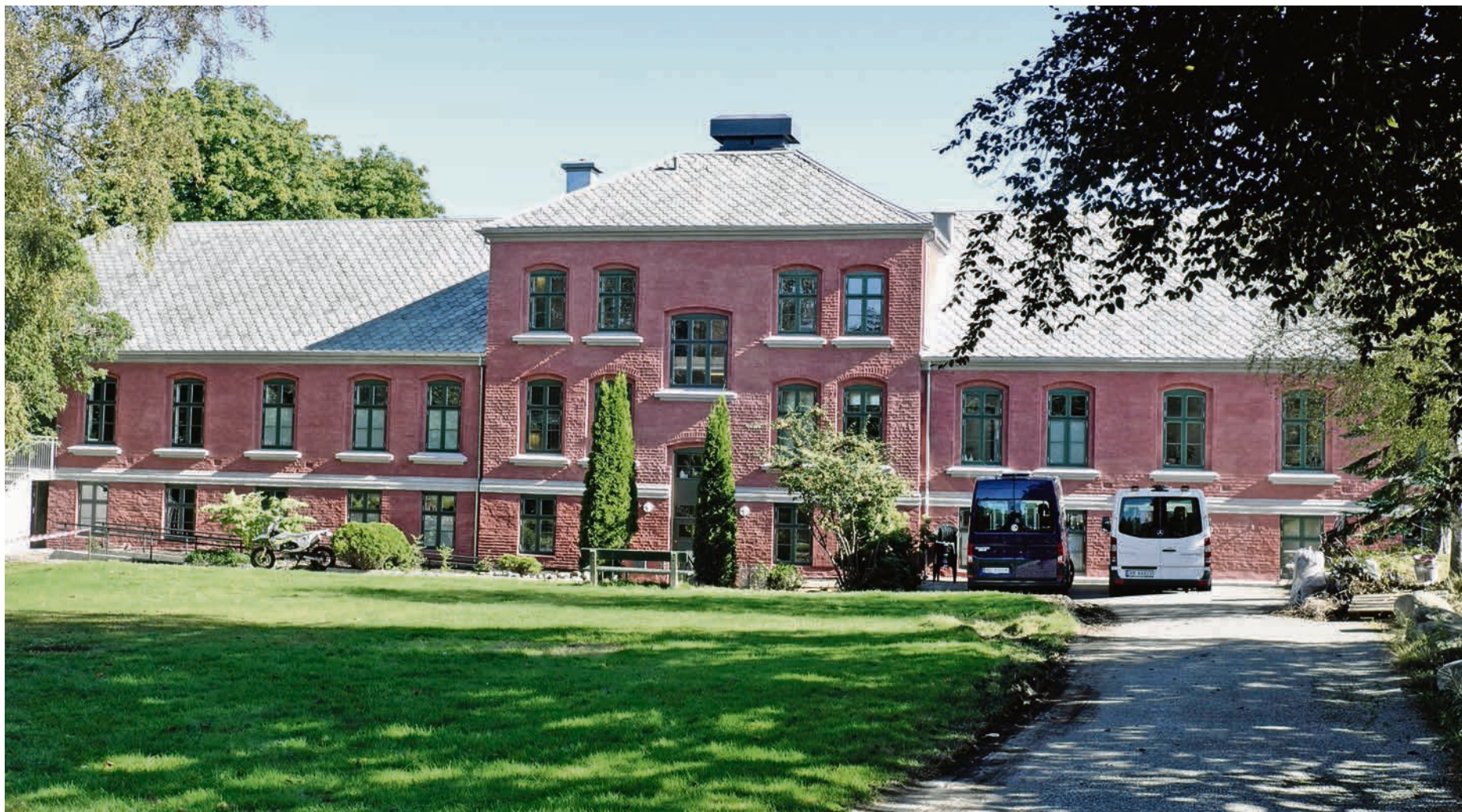
ORIGINALFARGE: Murbygningen på Hillevåg Arbeidsgård har fått tilbake sitt utseende omtrent slik det var da det sto ferdig i 1906.