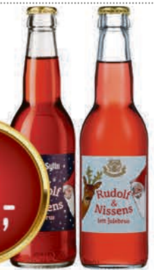
RUDOLF & NISSENS JULEBRUS 0.33 l Oskar Sylte pr. stk 10.00 /L