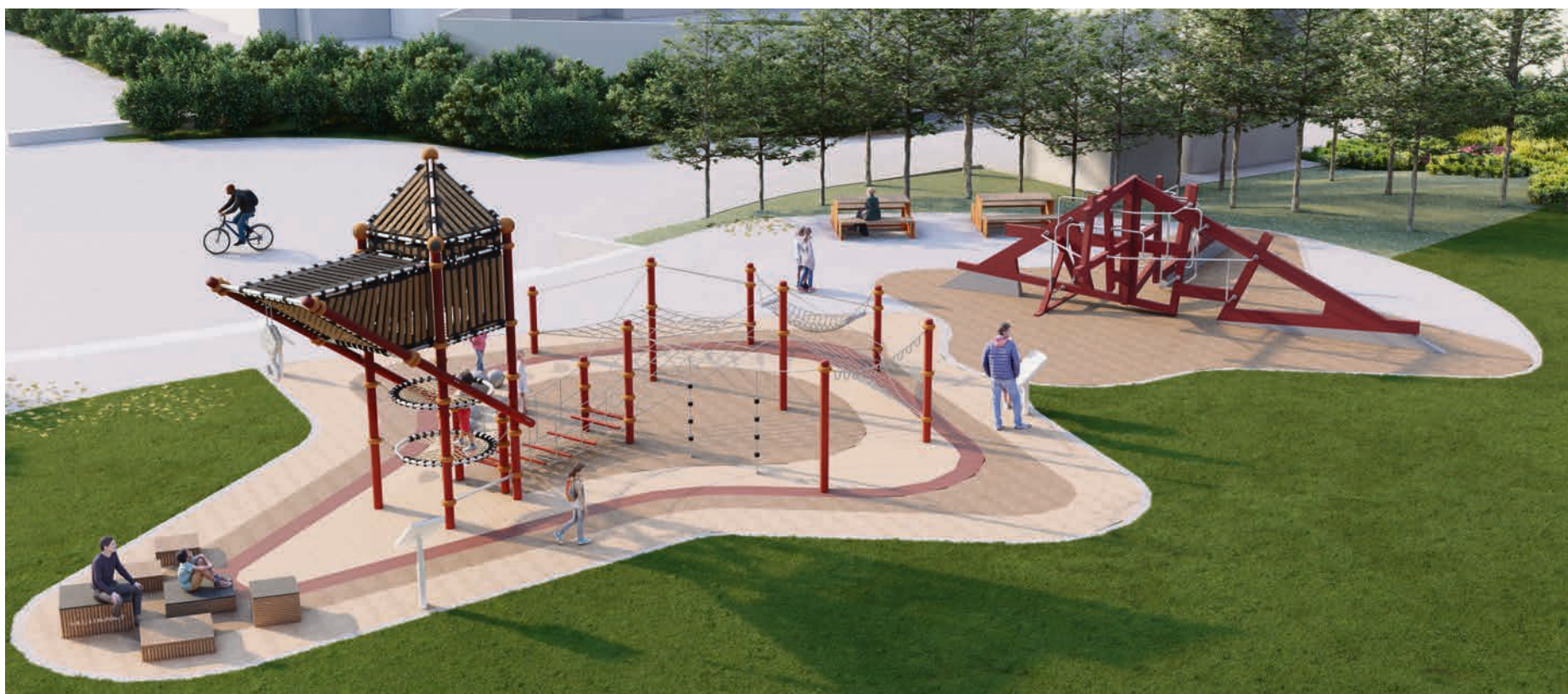
BILDETEKST: Og litt tekst som beskriver bildet.

I løpet av vinteren vil klatreinstallasjonen komme på plass. Byggingen starter 3. januar, og skal etter planen være ferdig etter to måneder. Blir det en kald vinter tar det lengre tid.