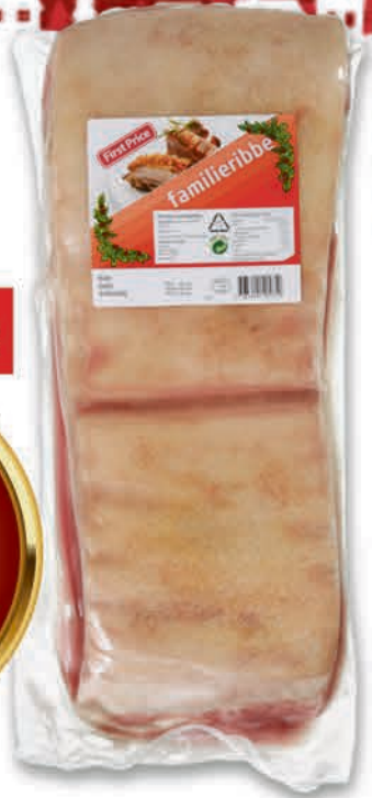
FAMILIERIBBE AV SVIN ca 2.8 kg First Price fryst pr. kg