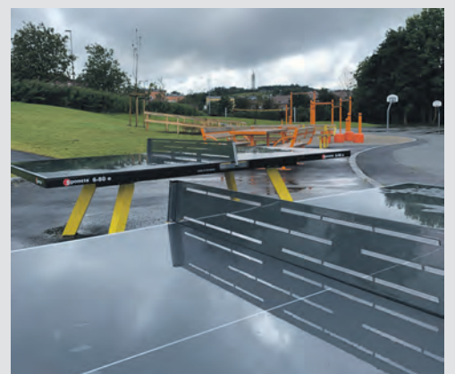
BORDTENNIS: Her kan du sydra kompisane eller venninnene i bordtennis.