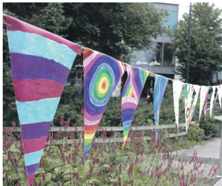
VIMPLER: Fargerike vimpler fra unge kunstnere ved Pippis kunstskole rammet etterhvert inn Torget.