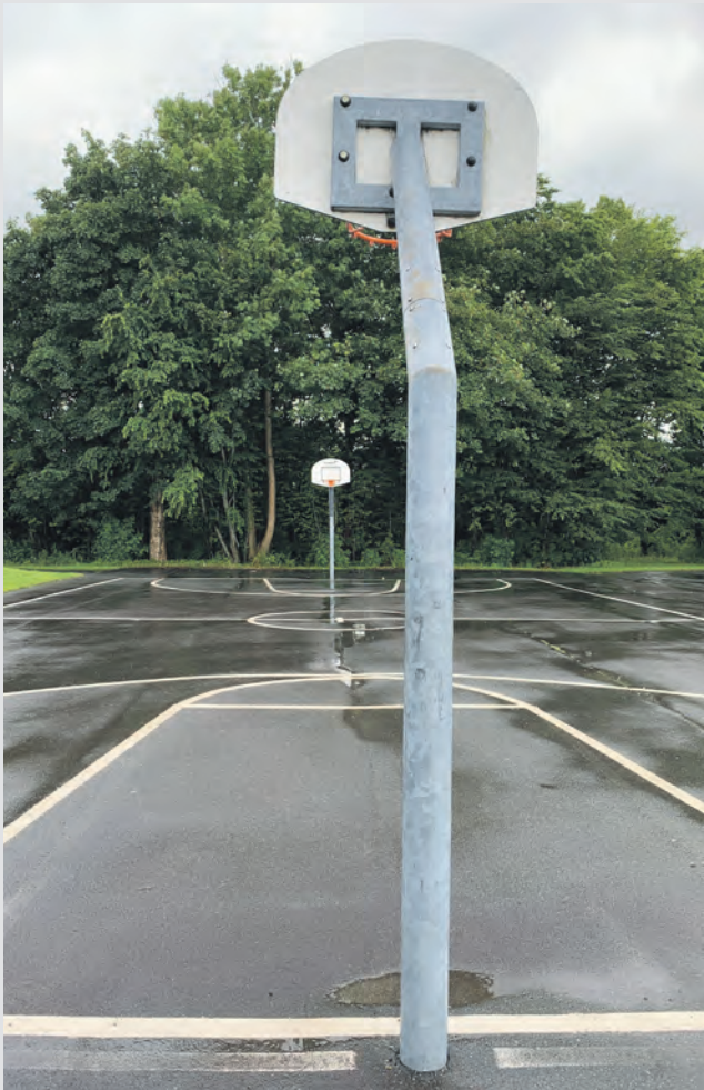
BASKET: Ka med å drømme seg vekk på denne banen, å lega du e store basketball stjerna ala Michael?

Visste du, at rett med Ullandhaug skole har de lagd te allslags aktivitetsbaner. Anlegget har nylig fått en betydelig oppgradering. Etter skoletid og i helger er det fritt fram for allmenn bruk, så her e det bare å kosa seg.