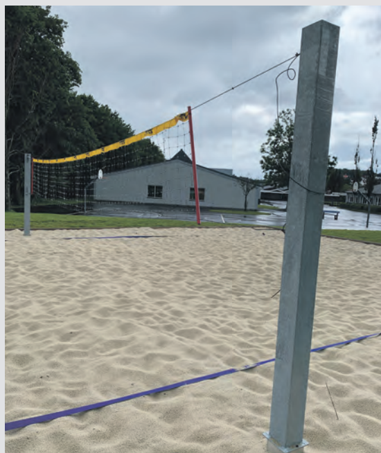
SANDVOLLEY: Itte OL e me e jo tross alt blitt ein foregangsnasjon i sandvolley.