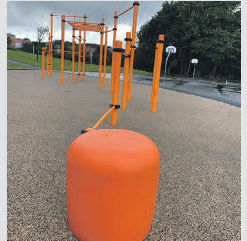
TURN: Klatra, henga opp ner, balansera eller turna.