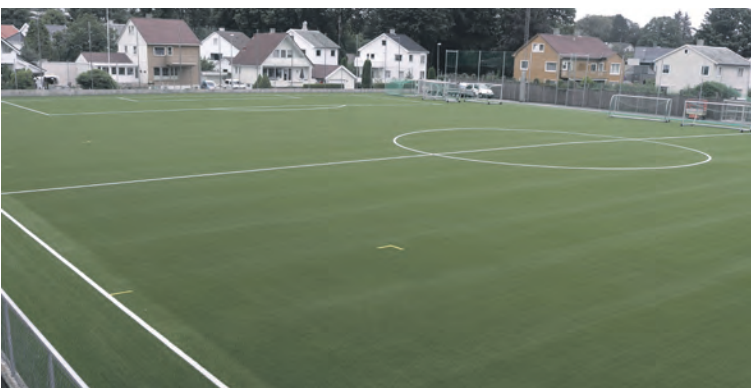
NYTT KUNSTGRESS: Kunstgresset var på plass og klar til å bli tatt i bruk i midten av august.

til gummikulene. Det neste på listen var en million kroner dyrere. Da synes jeg det er bedre med gjennvinning av bilhjul, sier Weihs til Hillevåg og Tjensvoll avis.