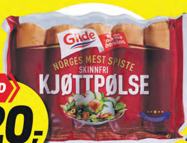
GILDE SKINNFRI KJØTTPØLSE 450 g pr. pk 44.44 /KG