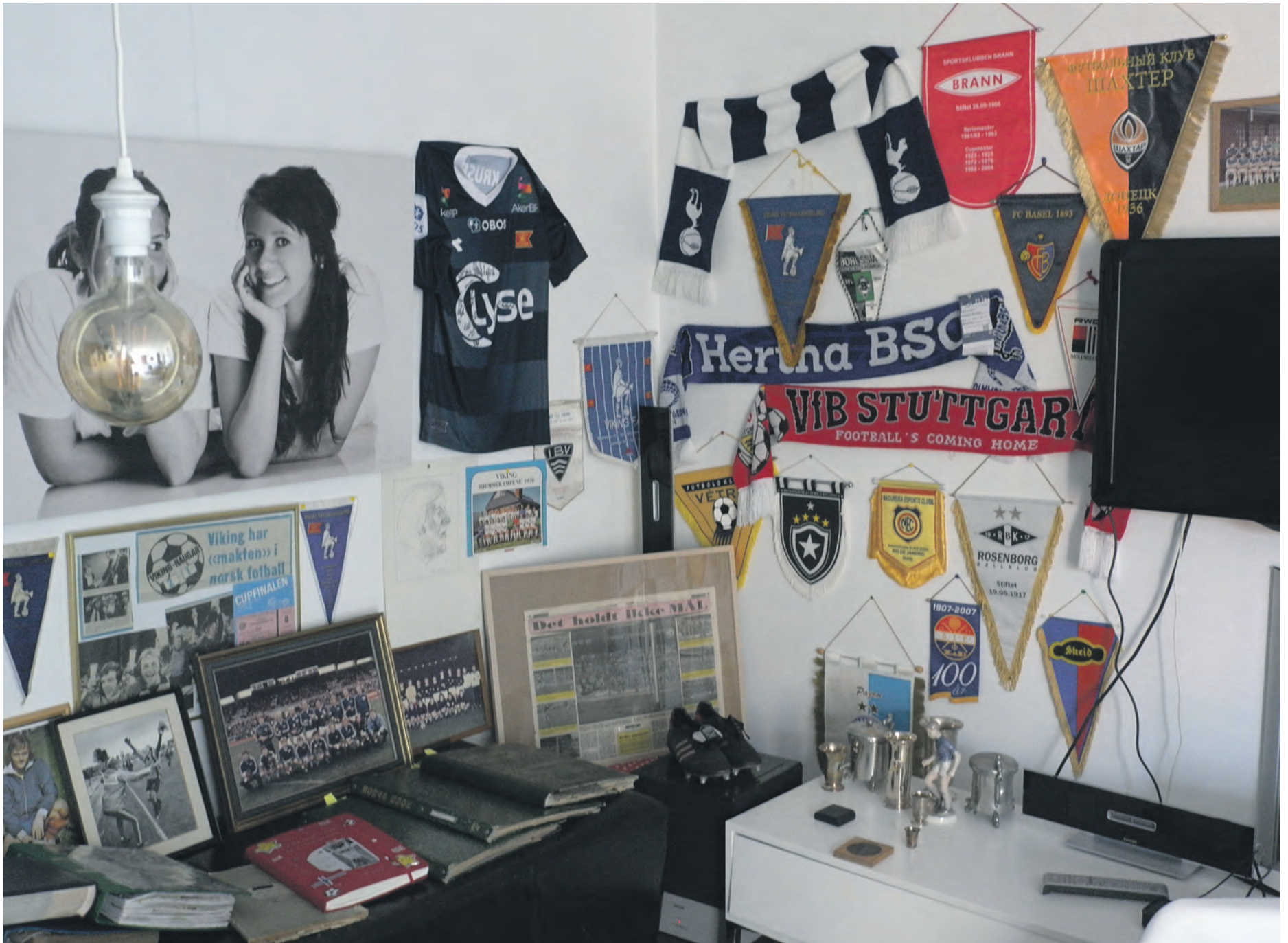
MINNER: Veggene i «hulen», der boka ble til, er dekket med gode fotballminner.