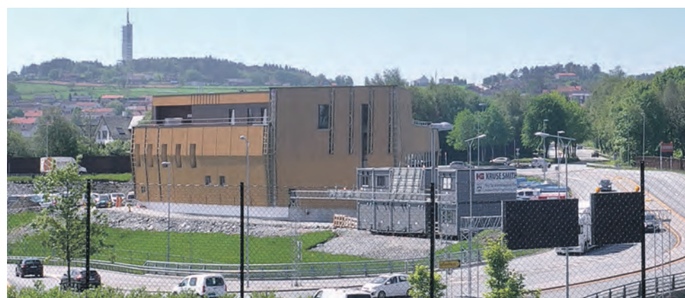
SCHANCHEHOLEN: Stasjonen ligger strategisk godt til med påkjørsel både nordover og sørøver Motorveien.

I alt skal 60 ansatte flytte ut fra Lagårdsveien. Hovedbrannstasjonen skal fortsatt være stasjonen på Stangeland i Sandnes. Stasjonen i Kvernevik skal fortsette.