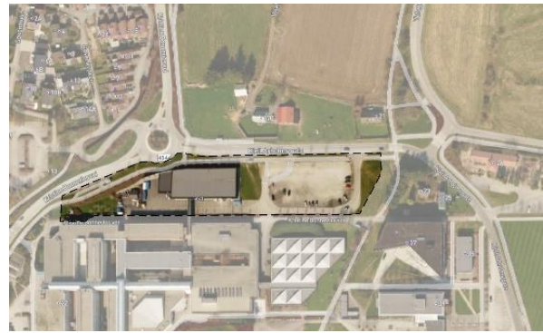
Figur 2 Planområdet markert på flyfoto.

Planområdet ligger helt nord på universitetsområdet. Planområdet grenser til undervisningsformål i sør, boligområde i nord-vest, annet landbruk i nord og et grøntareal samt enebolig og studentbolig i øst.