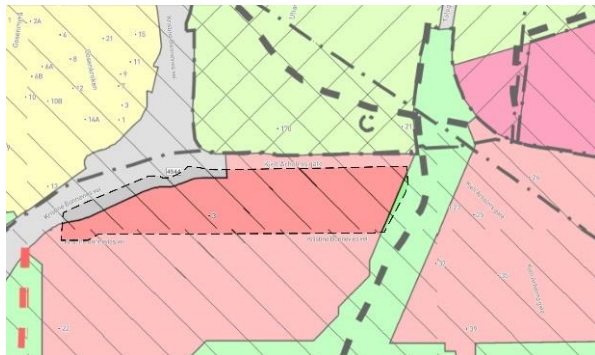
Figur 3 Planområdet markert på utsnitt av gjeldende kommuneplan

I gjeldende kommuneplan 2014–2029 er planområdet avsatt til undervisningsformål. I gjeldende områderegulering, plan 2510 – Områderegulering for universitetsområdet, er området avsatt til undervisning og tilhørende infrastruktur.