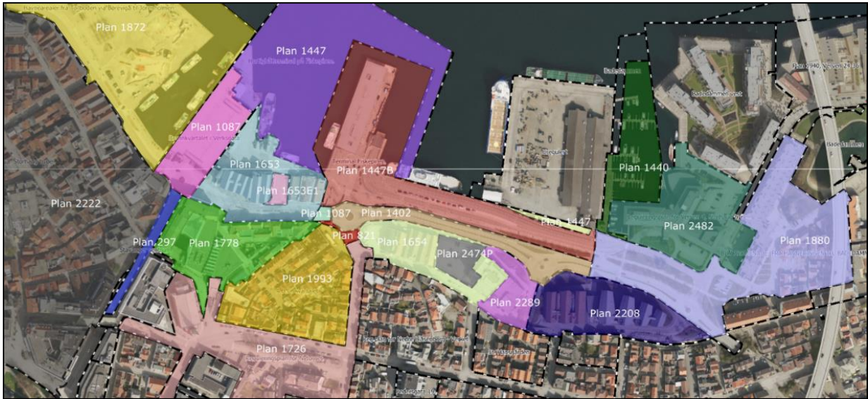
Figur 4: Oversikt over gjeldende reguleringsplaner (oktober 2018).

Planforslaget vil være i tråd med gjeldende kommunedelplan og reguleringsplaner i området, men vil medføre noen justeringer for Plan 1653, hvor det er regulert inn areal for forretning/kontor. Omlegging av ny adkomst til Jorenholmen vil berøre område avsatt til fremtidig grønnstruktur i sentrumsplanen.