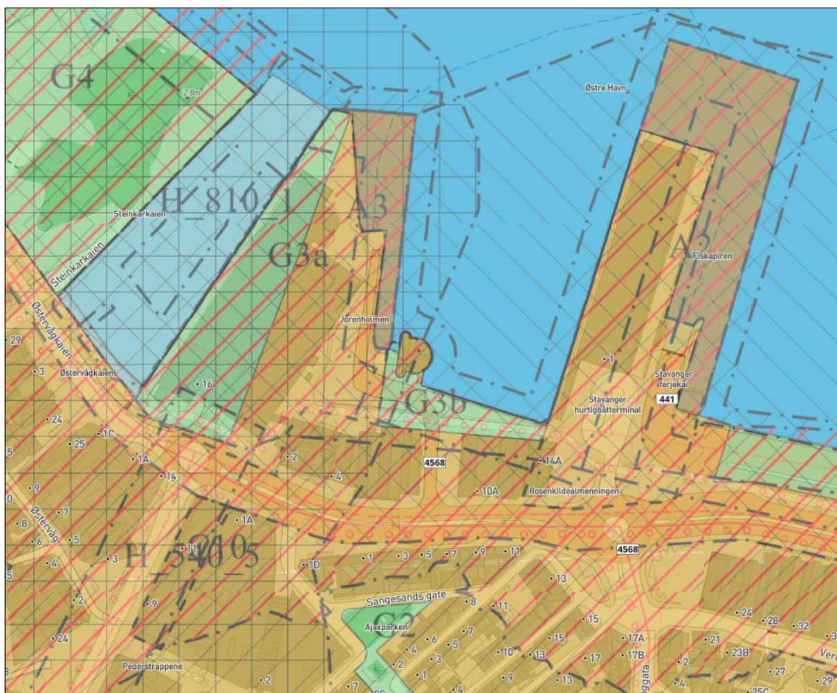
Figur 2: Kommunedelplan for Stavanger sentrum 2019–2034.

Sentrumsplanen legger opp til flere tiltak som er i tilknytning til prosjektet, blant annet: