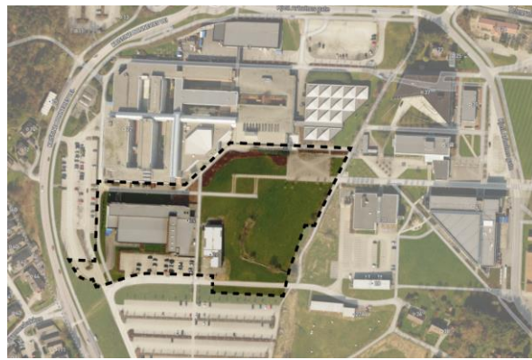
Figur 2 Planområdet markert på flyfoto.

Planområdet ligger på universitetsområdet, og i dag benyttes vestre del av planområdet (felt U8) til sportscenter og parkeringsplasser. Østre del (felt U9) består hovedsakelig av grøntareal, med unntak av noen brakker (paviljong 4). Planområdet avgrenses av Kjølvs Egelands hus i nord, parkeringsareal i vest, Rennebergstien i sør og parkareal i øst. Adkomst til området skjer fra sør ved Rennebergstien.