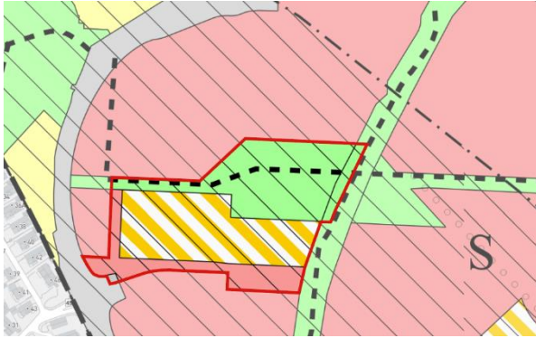
Figur 3 Planområdet markert på utsnitt av gjeldende kommuneplan