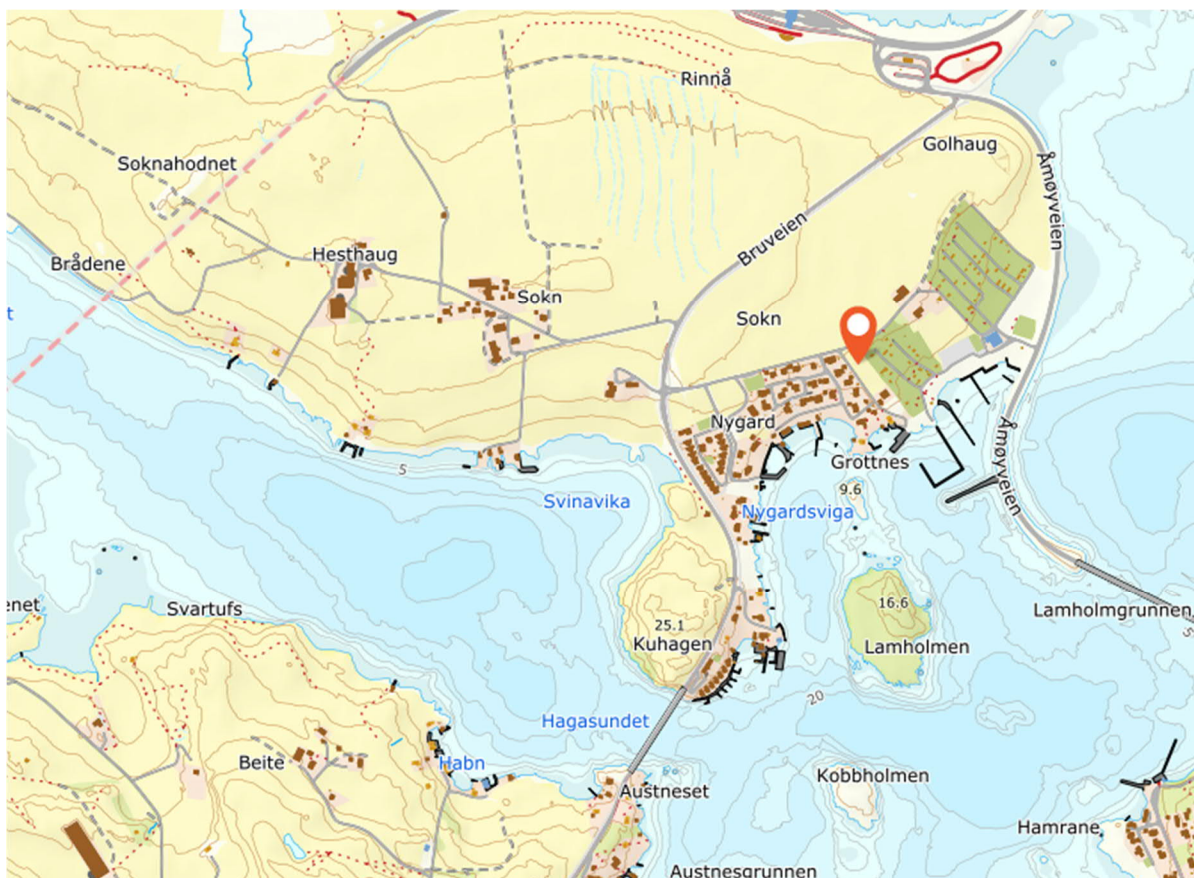
Figur 1: Kart som viser planområdets beliggenhet.

Planområdet ligger på Sokn i Stavanger kommune (ref. figur 1). Planområdet grenser til Campingplass i nord og øst, eks. boligbebyggelse i vest og LNF i nord.