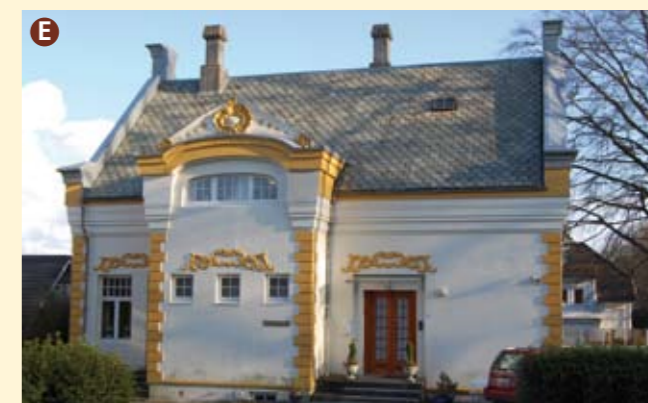
Eiganesveien 32, bygget i 1908 i historisk stil, med trekk fra flere ulike stilretninger. Den forseggjorte fasadedekoren er inspirert av barokk- og rokokkoarkitektur og er et morsomt eksempel på det som i Norge uformelt kalles "bollebarokk" – nybarokke utsmykninger i form av ornamenter og utskjæringer i runde former.