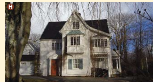
Holmeegenes ble bygget som lyststed av Gabriel Jansen Kielland i 1771. Om- og påbygget i 1910, med inspirasjon fra amerikansk sørstatsstil. Dette var hovedhuset til gårdsbruket Holmeegenes like bortenfor (Eiganesveien 64), som ble bygget som låve og pakterbolig for lyststedet.