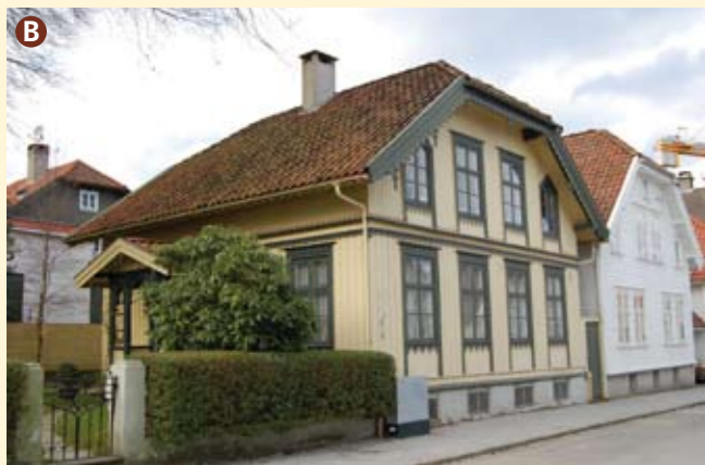
Olav Kyrres gate 6. Bygget i 1868 i tidlig sveitserstil. Gavlkneken som husene har i denne gaten, ble påbudt etter bybrannen i 1860 og skulle virke forebyggende mot brannspredning. Originale vinduer.