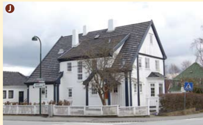
J Eiganesveien 82 er bygget i 1918 med trekk fra jugendstil, nyklassisisme og nybarokk. Det er nærliggende å tro at de blå kantene og pilastrene er inspirert av rokokkohuset Skagen 18 (Hansenhuset) i Stavanger sentrum. Takpannene er typiske for tiden og strøket.