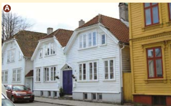
Olav Kyrres gate 10 og 12 – også kalt "tvinghingusene". Bygget i 1868 i empirestil med innslag av sveitserstil. Døren på midten leder inn i en gjennomgang til et felles gårdsrom på baksiden.