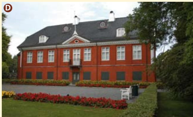
Herregården Ledaal ble bygget som lyststed for Kiellandfamilien i 1799-1803. Anlegget er fredet. I tillegg til museum har Ledaal funksjon som kongebolig og representasjonslokale for Stavanger kommune. Hovedhuset er i empire med innslag av barokk. Interiøret er rikt utstyrt med møbler og annet inventar i rokokko, Louis XVI, empire og biedermeier.