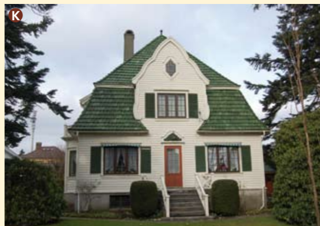
K Eiganesveien 91 er tegnet av arkitekt Lars Storhaug, som står bak mange hus i Stavanger, og ble bygget i 1915. Stiluttrykket er jugend/nybarokk. Den lille garasjen fra ca. 1930 er pent tilpasset hovedhuset.