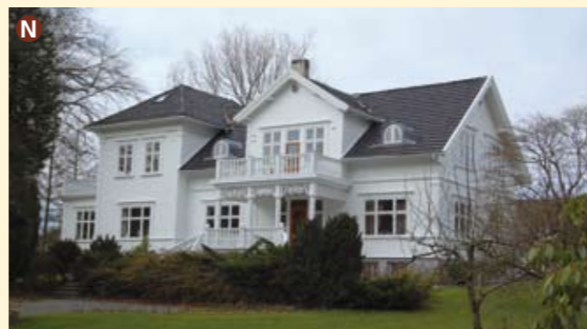
N Eiganesveien 113, med sitt store hageanlegg, brukes i dag som bispebolig. Huset ble bygget ca 1870-1890 i sveitserstil.