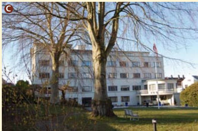
Wessels gate 51, Solvang sykehjem. Funksisbygg, tegnet av arkitekt Gustav Helland i 1936, rehabilitert i 1995. Under krigen hadde Stavangeravdelingene av Gestapo og det norske motsvaret, Stapo, sitt hovedkvarter i dette bygget. Bygget brukes i dag som aldershjem.