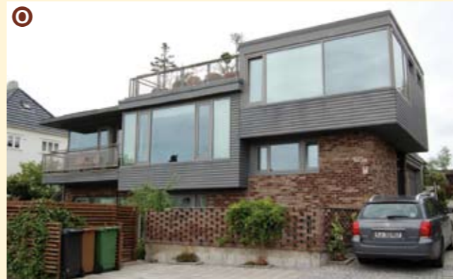
O Eiganesveien 163A og 165C er to eneboliger med moderne uttrykk i nyfunksjonalistisk stil. Bygget i 2001 som fortetningsprosjekt. Ark. Helen & Hard.