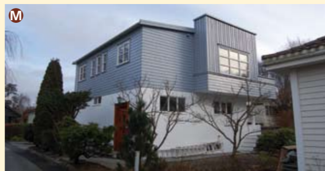
M Kroken 4 er tegnet av Alf Tønnesen og bygget i 1938 i funksjonalistisk stil. Legg merke til at dette og mange andre funksjonalistiske trehus ikke har hjørnebord/hjørnekasser, men panel med gjærede hjørner. Dette er typisk for stilen, og den lille detaljen er viktig for helhetsopplevelsen.