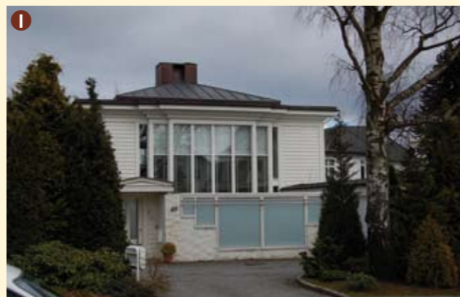
I Holbergs gate 49 er bygget i 1995 i nyfunksjonalistisk stil med klassisistiske trekk. Arkitekt Jan Inge Lindeberg. Dette huset regnes som et vellykket "infill"-prosjekt, som er tilpasset gjennom skala og materialbruk.

www.stavanger.kommune.no (se under plan og utbygging, kilder for bruk i planlegging) www.arkitektur.no (se under Norwegian Wood)