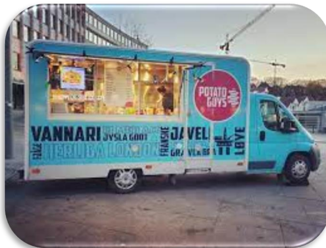
Nattsalg på Torget