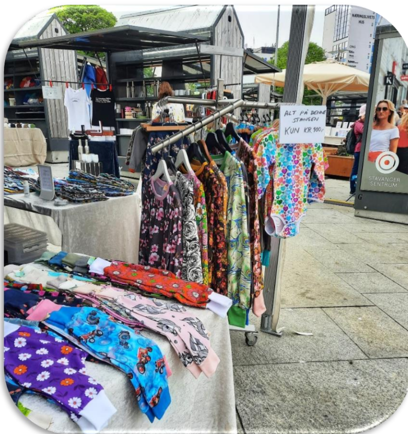
Husflid og håndverksmarked på Torget